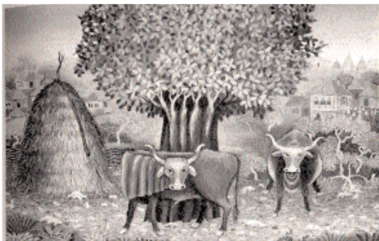
Slika 1. Živanović Slobodan, "Mesto susreta"

manje naivnog umetnika upliviše na temu njegovih slika. S druge strane, psihološki uslovi sredine dodatno opredeljuju takozvani spoljašnji motiv slike. Ova dvoslojna motivacija potiče iz racionalnog i iracionalnog aspekta umetnikove ličnosti, pri čemu bi racionalni aspekt obuhvatao formalnu komponentu umetničkog dela, dok bi iracionalan aspekt odgovarao komponenti značenja. Otuda se kao spoljašnja oznaka ili formalni aspekt slike pojavljuje grupa