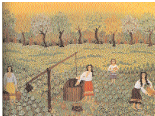
Slika 4. Pavlović Dušanka, "Polivanje bašte"

vaju predstavljene ne kao beslovesna, već kao bića obdarena dušom – njihov izraz lica i oči slični su ljudskim, ona međusobno komuniciraju, imaju svoju volju, grle se i pozdravljaju (slike 1,3). Ovakav prikaz na simboličan način ukazuje na poštovanje određenih životinja kao nosioca duša, u vidu karika iskonskog kružnog preobraže-