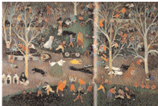
Slika 5. Jevtović Dušan, "Poplava"

Simbol bunara je jedan od elemenata univerzalne arhetipske strukture (slika 4). Uz kult "kamena", "vode", "drveta", "zmi-je", "kruga", "vatre", "mandale" i "raskršća" predstavlja važnu činjenicu duhovnog potencijala čoveka. Kao univerzalni arhetip i simbol nesvesnog, predstavlja vitalni princip i "rezervoar života" kolektivnog bića. Etnološki pragmatizam u srpskoj kulturi i folkloru može se očitovati u simbolu bunara sa značenjem smisla, izvora bivstvovanja. Istovremeno to je sinonim za izvor kolektivne istine na kome se ostvaruje svoja iskonska priroda (7,9,12,15).