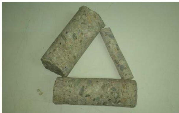
Slika 1. Mikrojezgra različitih prečnika

Prednosti mikrojezgara su u tome da i u gusto armiranom betonu se mogu izvaditi uzorci betona bez armaturnog čelika ili tkzv. neoštećeni uzorci. Isto je ponekad prosto nemoguće postići sa jezgriima betona standardnih dimenzija koja se uzimaju iz postojeće konstrukcije. Ideja je bila da se na mikrojezgrima uradi ispitivanje kapilarnog upijanja vode, prema SRPS EN 480-5 [4] na standardnim uzorcima i na mikrojezgrima izvađenim iz uzoraka oblika kocke sa dužinama ivica 20 cm. Takođe su predstavljeni i rezultati ispitivanja penetracije vode pod pritiskom na istim uzorcima, na kojima su prethodno uzorkovana mikrojezgra. Pošto standard SRPS EN 480-5 predviđa ispitivanje na uzorcima oblika prizme 4x4x16 cm, odlučili smo se za vađenje mikrojezgara prečnika 42 mm iz uzoraka oblika kocke dimenzija 20x20x20cm.