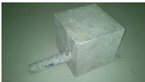
Slika 2. Uzorak mikrojezgra izvađen iz uzorka za ispitivanje vodonepropustljivosti

Od opitnih betona različitih mešavina napravljeni su, dakle uzorci betona oblika prizme i kocke sa gore navedenim dimenzijama. Uzorci su negovani u vodi do starosti betona od 28 dana. Nakon obrade i kondicioniranja uzorci oblika prizme su izmerena kapilarna upijanja vode prema SRPS EN 480-5 nakon 7 i 90 dana. Na uzorcima oblika kocke, dimenzija 20x20x20cm su prvo izvađena mikrojezgra prečnika 42 mm na dovoljnoj udaljenosti od površine na kojoj je kasnije izmerena dubina penetracije vode pod pritiskom prema standardu SRPS EN 12390-8 (Slika 2.)[5].