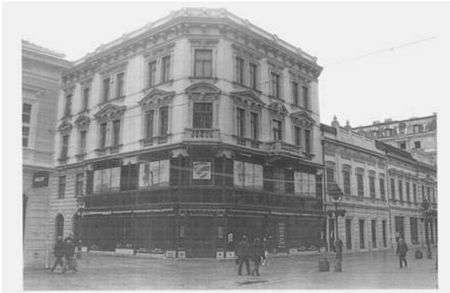
Слика 1 – Поглед на куће под бројем 41, 43 и 45 из Кнез Михаилове улице