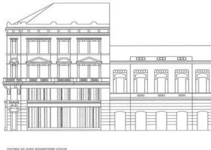
Слика 5 – Идејни пројекат културног центра – изглед из Кнез Михаилове улице (цртеж: Марко Николић, према Архиви града Београда постојећег стања)

На делу приземља и првог спрата, тј. мезанина, фасаду чине стаклене површине (излози) које се оживљавају са унутрашње стране лаким покретним паноима различитих боја у комбинацији са дизајнираним словним знаковима различите величине. На тај начин се ове стаклене површине оживљавају и чине привлачнијим. Остали део фасаде задржава свој аутентични изглед. (слика 5)