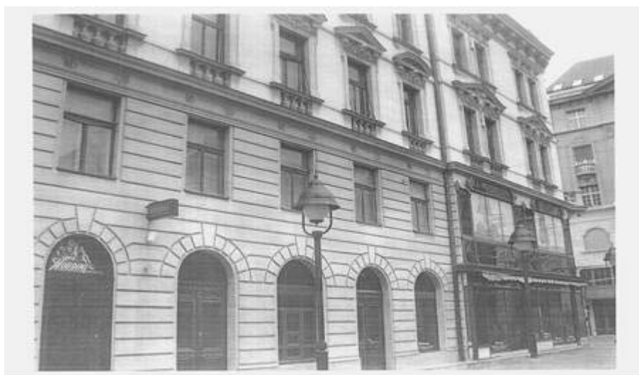
Слика 3 – Поглед на кућу под бројем 41 из Ускочке улице