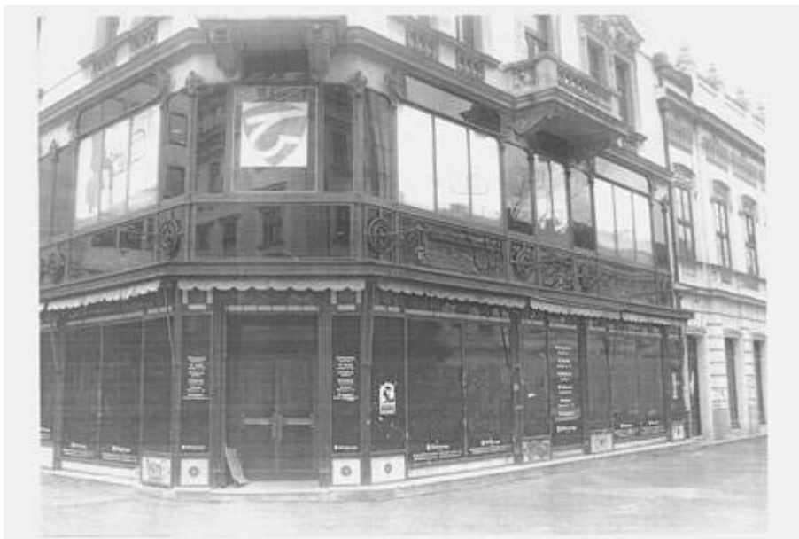
Слика 2 – Изглед приземља и мезанина куће под бројем 41 из Кнез Михаилове улице