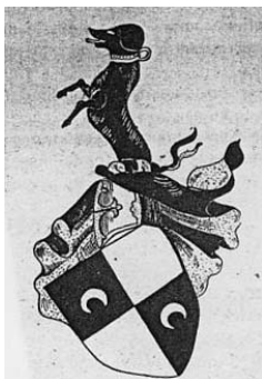
Грб Храбреновића, према рукопису Корјенић-Неорића из 1595. године

Милорадовићи су хумска властела, која се појављује у 14. вијеку. 64 Спомињу се у 14. вијеку као „људи Павловића”, 65 што биљежи и Ђуро Даничић у свом Ријечнику из књижевних старина српских . 66 Породица је била врло разграната, па их налазимо касније и у Зворнику и у Бања Луци.