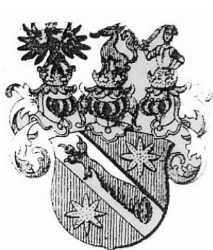
Грб Љубибратићиња – ѿлемићи