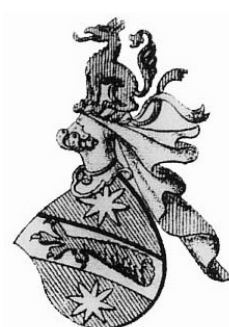
Грб Љубибратићиња – барунски

Љубибратићи су у средњем вијеку били врло угледна српска племићка породица, из мјеста Луга у Попову. 30 У Повељи кнеза Павла Раденовића из 1397. године, којом се гарантује Дубровчанима слобода трговине у његовој земљи, помињу се као свједоци и његови племићи „от Приморја ”, познати требињски великаши: Вукосав Кобилчачић, Љубиша Богданчић и Вукосав Познановић. Љубибратићима, који су доминирали „требињском државом” припадао је и Љубиша Богданчић. Племићка породица Љубибратићиња господарила је у 14. и 15. вијеку Травунијом (Требињском облашћу) и била је подијељена у више грана: Љубишићи, Медвједовићи, Дабизиновићи, Радивојевићи, Добрушковићи, Куделиновићи, Богданчићи, Мрђеновићи и Миокушевићи. 31