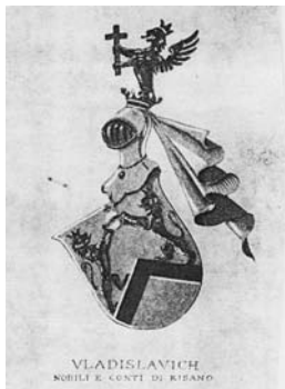
Грб Владиславића (conte de Risano)

Између Јасеника и Берушице, у околини Гацка, живјела је српска племићка породица Владиславићи. 53 Породица је била племићка у вријеме српског царства те за отоманске владе, до свог боравка у Гацку. 54 Пребјегли су у Црну Гору због притисака (напада) Чен-