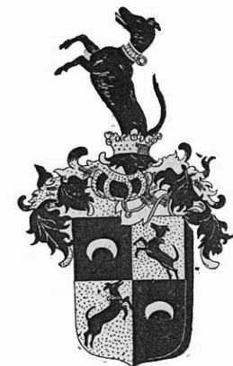
Грб Јеронима и Мојсија Милорадовића из 1760. године

Милорадовићи су хумска властела, која се појављује у 14. вијеку. 64 Спомињу се у 14. вијеку као „људи Павловића”, 65 што биљежи и Ђуро Даничић у свом Ријечнику из књижевних старина српских . 66 Породица је била врло разграната, па их налазимо касније и у Зворнику и у Бања Луци.