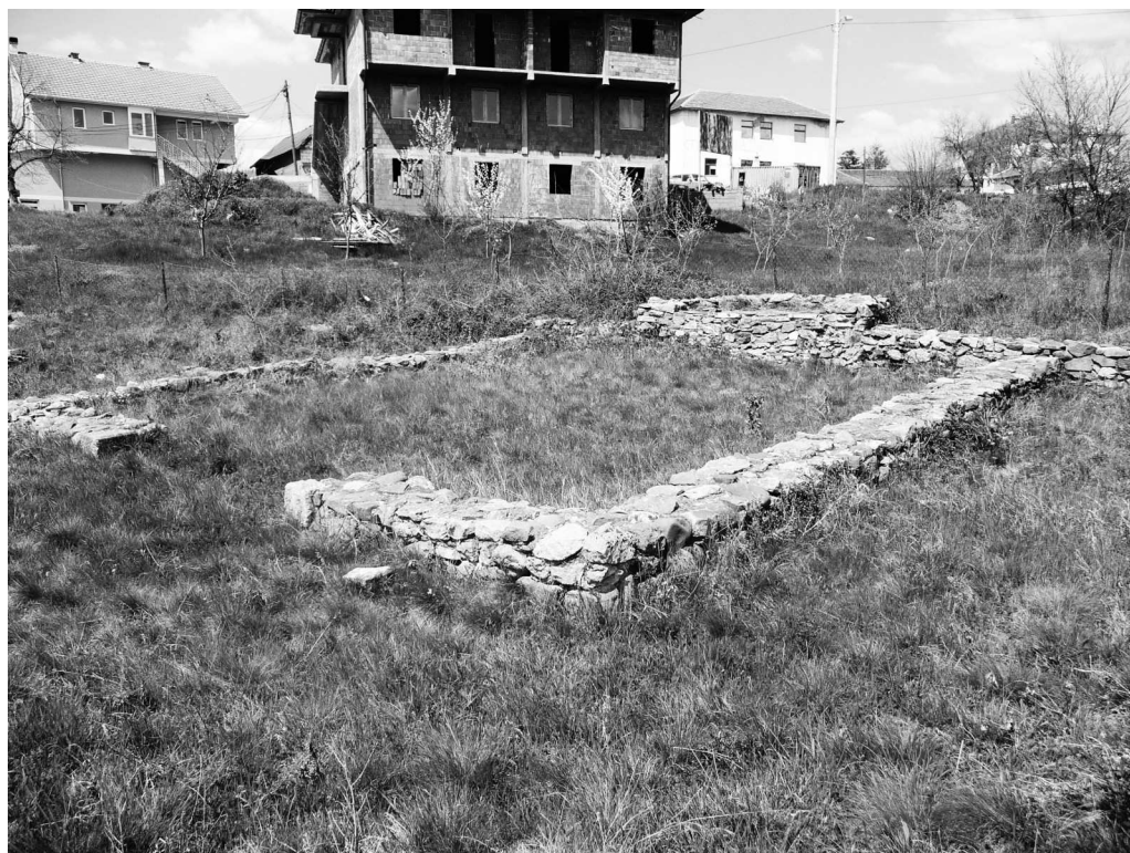
СЛИКА 3: ОСТАЦИ ХРАМА У СОЧАНИЦИ.