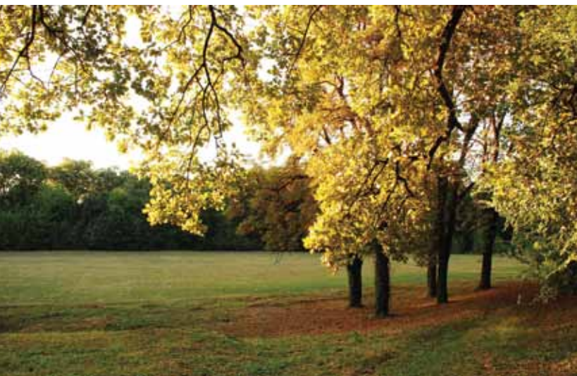
Сл. 6. Неодржавани спортски терен (аутор: Драгана Јокмановић, септ. 2011)