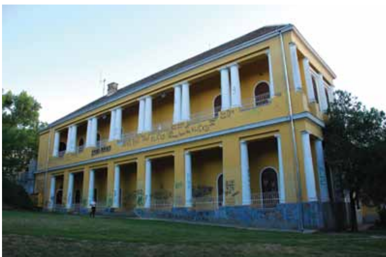
Сл. 1. Источна фасада дворца Марцибањи-Карачоњи (аутор: Драгана Јокмановић, септ. 2011) Fig. 1. East facade of the Marcibanyi-Karacsanyi castle (author: Dragana Jokmanović, sept. 2011)