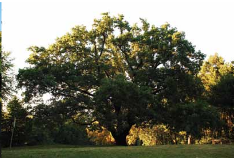
Сл. 5. Један од два сачувана храста, старости око 250 година (аутор: Драгана Јокмановић, септ. 2011) Fig. 5. One of the two preserved oaks, around 250 years old (author: Dragana Jokmanović, sept. 2011)

Идентитет, то јест особеност или јединственост парковске и сваке друге јавне површине, јесте основни аспект трансформације (ревитализације) постојећих проблематичних јавних површина. За разлику од значења, он се открива, назире и делом претпоставља у оквиру процеса дизајнирања. Ауторка Ирен Курули (Irene Curulli) обрађује тему рециклирања на просторном нивоу града, односно ревитализације запуштених простора и њихов нов значај и коришћење. Притом, она наглашава проблем који се често