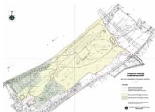
Сл. 3. Постојеће стање парка са зонама заштите (Споменик природе Каменички парк / Карта са границом и режимима заштите, извор: Завод за заштиту природе Србије, Нови Сад, 2005) Fig. 3. Existing park layout with protection zones (Natural Monument Kamenicki Park / Map of the borders and protection regimes, source: Institute for Nature Protection of Serbia, Novi Sad, 2005)