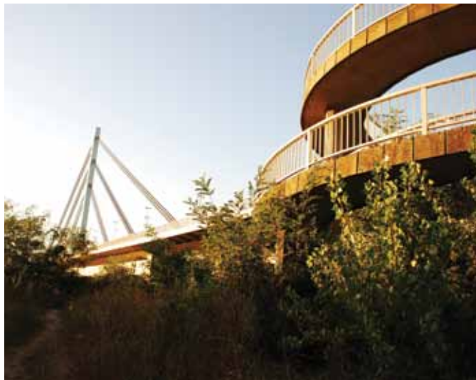
Сл. 7. Улаз у парк са моста Слободе (аутор: Драгана Јокмановић, септ. 2011)

Квалитет Каменичког парка неоспорно је велик према вреднованој структури и ефектима постојеће вегетације. Међутим, показало се да та врста естетике парка-шуме нема значајнијег ефекта на социјална дешавања и већи осећај локалне припадности, првенствено због немара и лошег одржавања (сл. 6-7). С друге стране, вредности добијене за коришћење показују могућности да се Каменички парк, с одговарајућим улагањем, уврсти у јавне просторе од градског значаја. Не би требало заборавити да, иако су неки од циљева за сваку парковску површину код нас: повећање коришћења, мултифункционалност и способност простора да се прилагоди различитим потребама корисника, лоше искоришћени капацитети јесу последица лоше дистрибуције зеленила у систему зеленила града, а лош концепт парка може узроковати конфликте у коришћењу. Ови конфликти такође се јављају због лошег планирања основне намене зелених површина, као и због њихове нејасно дефинисане улоге (рекреација или заштита природе и унапређење биодиверзитета), што је основни проблем Каменичког парка. Могућност планског решавања проблема коришћења зависи од већег обима друштвене организације, што укључује: корисничке групе у плански процес решавања, планирање разноликих простора за приватно и колективно коришћење у непосредном окружењу парка, омогућавање планског управљања зеленом површином са свим заинтересованим