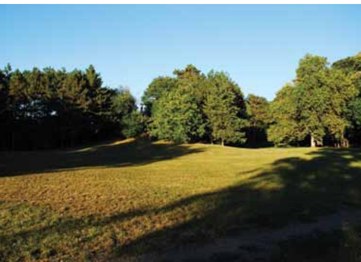
Сл. 4. Централна травната површина парка у енглеском пејзажном стилу Fig. 4. The central park lawn in the English landscape style

ког потичу. Аутор претпоставља да је садржај основни материјал дизајна пејзажне архитектуре, којим се ствара уживање и/или значење у оквиру зелених површина. Такође, он предлаже и листу могућих извора садржаја – екологија, социјално-историјски аспект и форма (Treib, 2005). Како је еколошка вредност Каменичког парка једини садржај који се истиче током дугог низа година, поставља се питање да ли је могућ стратегијски оквир који би унапредио квалитет јавног простора а да су притом испуњени потенцијали према потребама, праву и значењу. Савремене теорије препознају квалитетне градске зелене површине ако оне, на првом месту, као јавни простори промовишу социјалну добробит, док је идентитет крајњи резултат, позитиван ефекат унапређења естетике и економске одрживости простора. У том смислу, чест проблем сагледавања паркова у Србији (а самим тим и Каменичког парка) јесте да се per se плански и пројектантски њихово значење своди на слику очуване еколошке урбане оазе, што је једнострано тумачење принципа одрживости. Као последица тога јавља се изолација од друштвених активности и стварање статичног идентитета простора, што је у супротности с процесним, еволутивним схватањем дизајна у оквиру одрживог развоја, карактеристичним за природне системе и средине попут зелених површина (сл. 4-5).