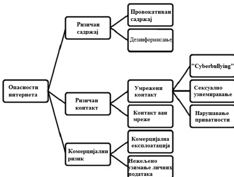
Слика 1. Преглед опасности и ризика интернета (Valcke et al., 2011)

У сваком случају, не оспоравајући вредност и образовни потенцијал интернета, који је вероватно још увек недовољно искоришћен, чињеница је да се у јавности све чешће говори о опасностима и ризицима употребе интернета, како би се пажња усмерила на могућности превентивног и куративног деловања у циљу безбедног коришћења оваквих облика интеракције и комуникације. Неки аутори (Valcke et al., 2011) истичу да је основне опасности интернета могуће поделити у три категорије: ризичан садржај, ризичан контакт и комерцијални ризик (слика 1).