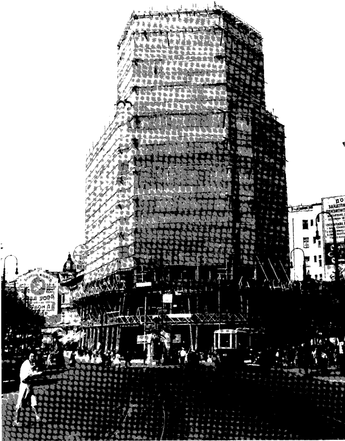
Сл. 3. Палаћа »Албанија« у току изградње

шавају једну зграду у некој споредној улици... Знатан број наших познатих архитеката није учествовао на овом конкурсусу... Један од главних разлога је уобичајено укидање прве награде... Затим слободно давање извођења зграда и врло често неугодни састави жирија, односно неправедне оцене нацрта. На конкурсима дешавало се укидање прве награде и када су нацрти били задовољавајући. На тај начин је сопственик хтео да има одрешене руке коме ће да да извођење радова... Међу архитектурама се скоро са математичком тачношћу зна, ако учествује тај и тај архитекта, да ће добити награду, без обзира на успешно решење задатка.... Иако се за одлуку жирија за зграду »Албаније« то не може рећи, ипак ранији такви поступци утицали су на одсуство многих архитеката на овом конкурсусу. Жири за зграду »Албаније« иако није погрешно у оцени, он је учинио другу погрешку што је укинуо прву награду...» 12