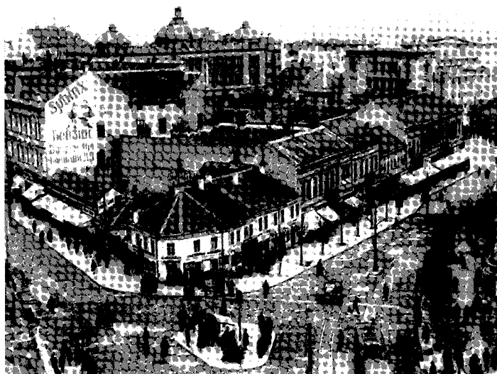
Сл. 1. Кафана »Албанија«