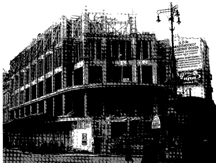
Сл. 2. Палаћа »Албанија« у изградњи