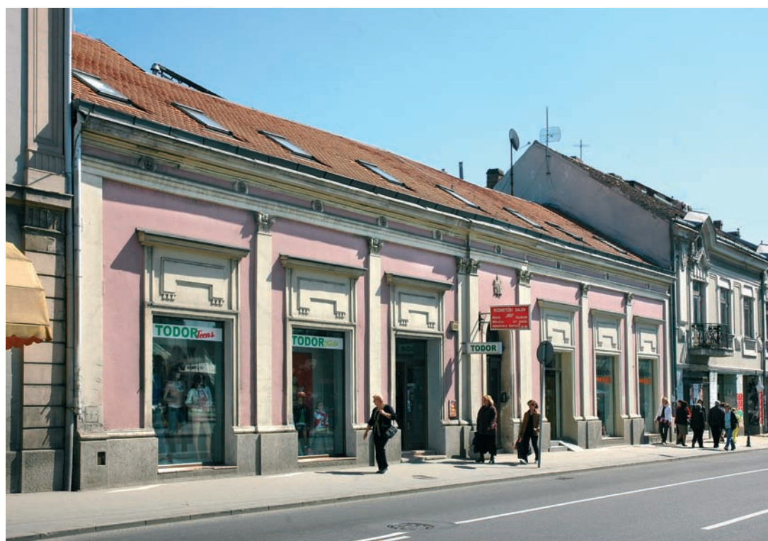
Сл. 3. Садашњи изглед Абијанове куће (април 2009)

Сад већ стара кућа с измењеним изгледом pročела, ипак је сачувала изглед поткровног венца с плитком