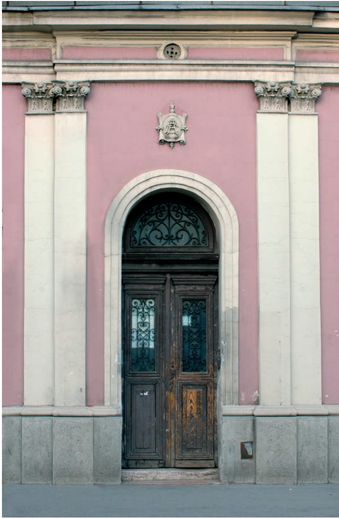
Сл. 4. Стилска капија и медаљон са иницијалима СА.

малтерском профилацијом и округлим отворима (розете), смањени број пиластара, капију и медаљон. Уска, висока дрвена капија с полукружним светларником заштићена је гитерима од кованог гвожђа. Она показује умеће домаћих занатлија и укус грађана који су овом детаљу посвећивали посебну пажњу. Нажалост, она је у непримереном стању: давно није бојена и недостаје јој брава. Изнад капије је медаљон урађен у гипсу или малтеру с иницијалима имена и презимена бивше власнице – испреплетена слова CA ( Carolina Abian ).