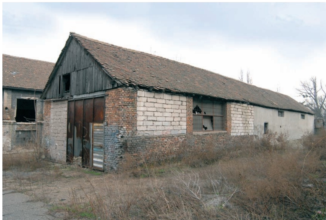
Сл. 6. Водена барака, саграђена 1950. године на месту где су подигнута вешала за егзекуцију логораши, између објеката 1 и 2

предвиђао је рушење свих затечених објеката на том простору. Тим поводом стручњаци Завода за заштиту споменика културе града Београда израдили су елаборат конзерваторских услова за овај простор. На стручном већу ЗЗСКГБ поводом пројекта станице „Југ“ била су изражена два става: