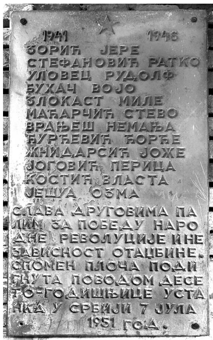
Сл. 3. Спомен-обележје на објекту 1