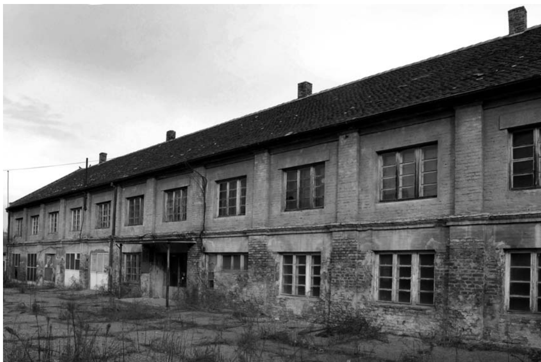
Сл. 2. Логорски објект 1

стратишта симболишу ово време страховладе и масовне насилне смрти. Према досадашњим истраживањима, на тлу Краљевине Југославије у Другом светском рату организован је 71 концентрациони и сабирни логор, 329 истражних и других затвора, а држављани Краљевине Југославије били су у 69 логора и њихових подручних логора ван земље.