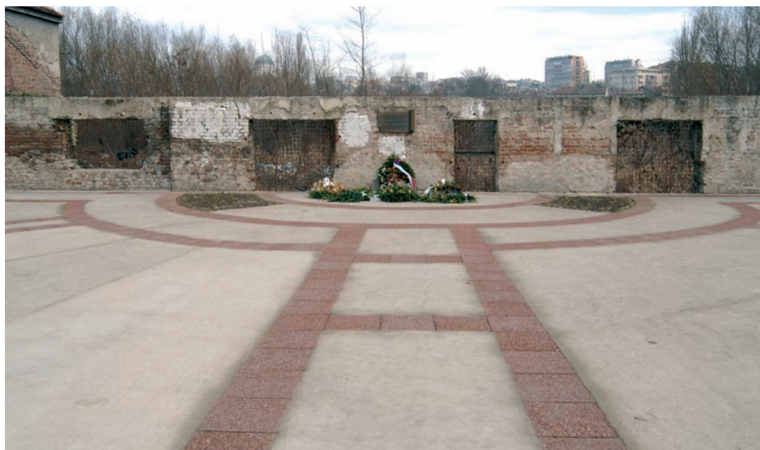
Сл. 4. и 5. Меморијал и спомен-обележје страдалим Јеврејима и Ромима