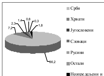
Графикони 1 и 2: Етничка структура становништва Вашице (%) према пописима 1971. и 2002. године