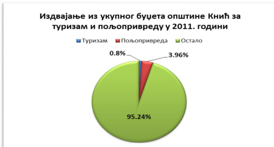
Слика 2. Budžet opštine Knić i izdvajanje za turizam i poljoprivredu u 2011. g. 6

Najveći ekonomski efekat imaju seoska domaćinstva koja se bave poljoprivredom i ruralnim turizmom. U okviru aktivnosti bavljenja ruralnim turizmom mogu da uključe gotovo sve članove domaćinstva. Svoje proizvode mogu da prodaju kao finalne, a ekonomska dobit znatno je veća. To se može potvrditi kroz primer domaćinstva koje se bavi ruralnim turizmom i poljoprivredom i domaćinstva koje se bavi samo ruralnim turizmom.