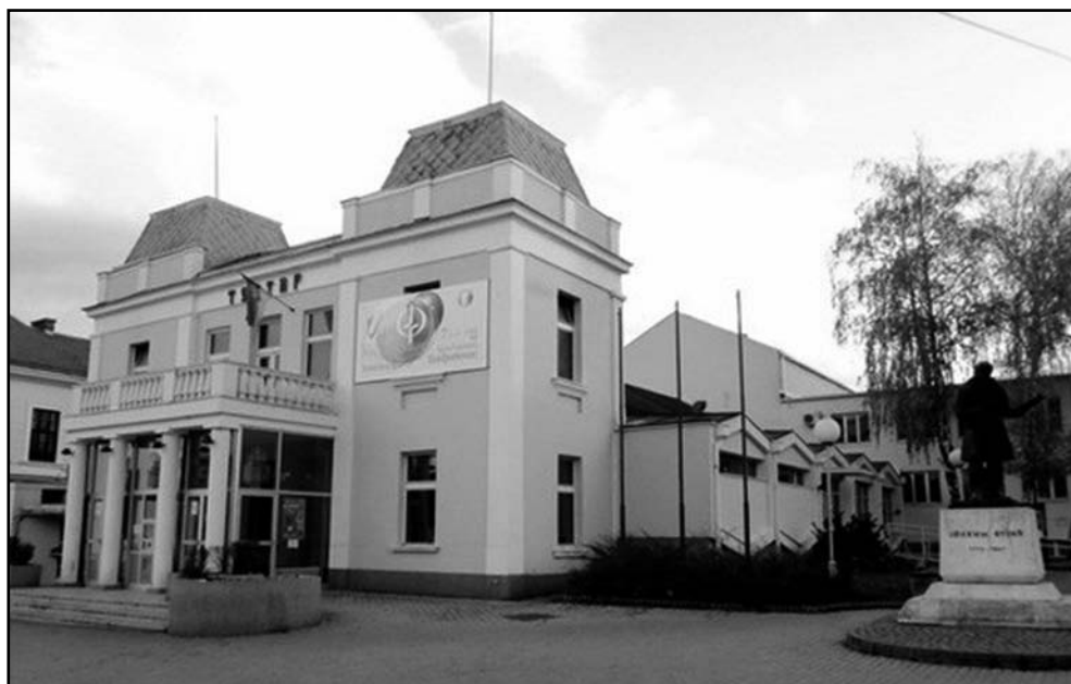
Слика 6: Звезда „Књажевско-српској театра” и биста Јоакима Вујића (десно)

текстовима домаћих аутора. Крагујевачко позориште од октобра 2006. године домаћин је и „Јоаким Интер Феста”, међународног позоришног фестивала малих сцена.