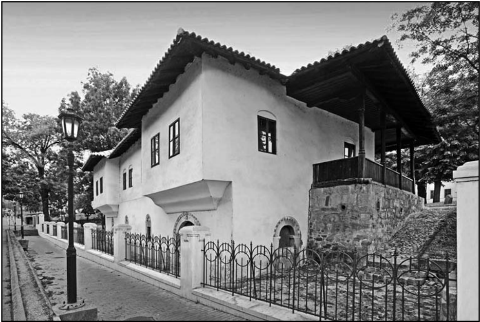
Слика 1: Амиџин конак – једини, до данас, сачуван објекат из дворског комплекса кнеза Милоша.

лић (1972: 428) открива увидом у прву књигу Петровићевог дела „Финансије и установа обновљене Србије” из 1897. године), Кићовић тврди, на основу једног Вујићевог саслушања у Панчеву 8. јула 1834. године, као и на основу писма новосадског књижара Георгија Карјаковића Вуку Карацићу у коме пише да је Вујић у септембру 1834. године прешао у Србију, да је у Крагујевац дошао баш 1834. године. (Кићовић, 1960: 16).