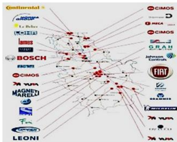
Slika 1 – Direktne strane investicije u automobilsku industriju

Greenfield projekti u Srbiji kao destinaciji su se povećali sa 2,53 milijardi dolara u pretkriznom periodu na 3,71 milijardi dolara u 2013.godini.