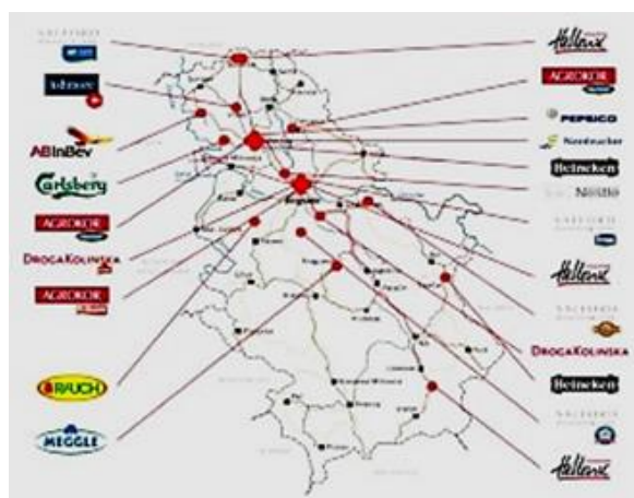
Slika 2 – Direktne strane investicije u prehrambenu industriju