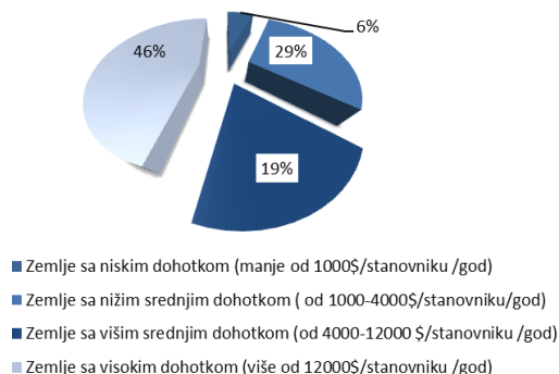
Slika 1. Procentualni udeo generisanja komunalnog otpada prema bruto nacionalnom dohotku [12]

Treba istaći da otpad u najvećoj meri sadrži organske materije (biorazgradiv otpad), u koje se ubraja hrana, baštenski otpad, tekstil, drvni i papirni proizvodi [1]. Sa promenom načina života, odnosno standarda, dolazi do promene količine i morfološkog sastava komunalnog otpada. Značajan uticaj na masu komunalnog otpada ima: stepen industrijskog razvoja, način stanovanja, socijalno okruženje, potrošnja energije za zagrevanje stanova, učestalost sakupljanja i odvoženja smeća, nivo životnog standarda, porast ukupnog broja stanovnika u gradu, kao i drugi sezonski, geografski i demografski faktori. I pored toga što se komunalni otpad smatra neopasnim, ovaj otpad ipak sadrži male količine potencijalno opasnih komponenti kao što su: sredstva za čišćenje, baterije, lekovi i dr. [2] Količina otpada se konstantno povećava, kao posledica naglog, ubrzanog rasta urbane populacije i rasta standarda u razvijenim zemljama, uprkos dramatičnim upozorenjima ekologa.