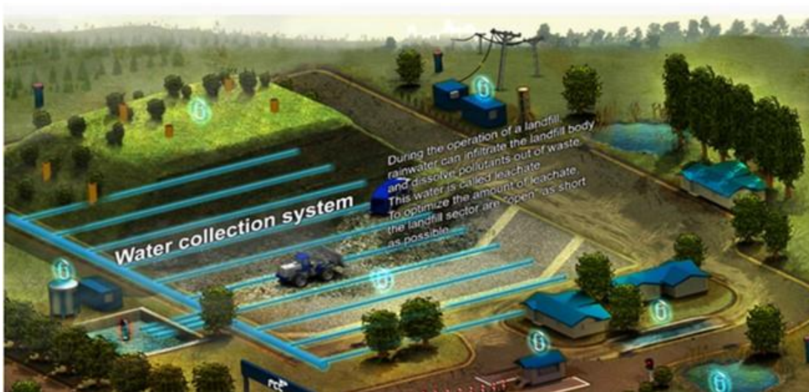
Slika 7. Sistem za upravljanje procednim vodama na deponiji "Kikinda"

Procedna voda koja se uliva u bazen za aeraciju je uglavnom oslobođena krupnih čestica mulja, čime je omogućen ulazak procedne vode u perforirane cevi. Perforacije na cevima su veličine 0,1 mm.