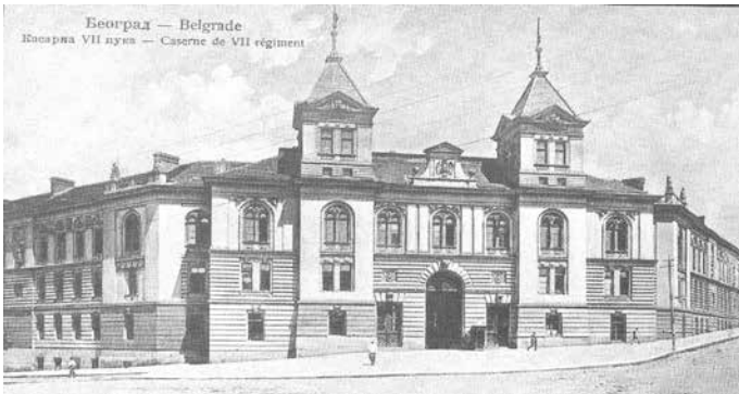
Слика 3 Касарна VII пука, Београд (извор: Несторовић, Б. Архитектура Србије у XIX веку )

оваквих законских одредаба, десило се да и пројекат једне од најлуксузнијих касарни 47 и репрезентативних јавних грађевина у престоници, Касарна VII пука у Београду (грађена крајем 19. века, саграђена 1901?), буде предмет критика са становишта санитарских карактеристика. 48 Поред тога, њена позиција у градском ткиву, није била у складу са ондашњим стручним промишљањима. Наиме, војни стручњаци су сматрали да касарну „нити је треба градити у вароши самој – из узрока лако појмљивих – нити је треба градити далеко ван вароши – те да се не отежава лак и удобан сношај и саобраћај са вароши, и обитаоцима касарне и, нарочито официрима, који имају своју службу у касарни, а у дотичној вароши станују. 2) Касарну треба градити на окрајини вароши дотичне, оној, која није на страни, у којој варош тежи, и по положају своје треба, да се развија. 3) Место за касарну треба да је узвишено над нивоом дотичне окрајине варошке, у којој се касарна гради.“ 49 Позиција Касарне VII пука није одговарала ни захтеву да „пред излазом из зграде треба да има простран трем, те да не буде нагомилавања људи на самом излазу из зграде, како при уласку у њу.“ 50 (слика 3)