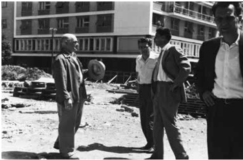
Слика 2 Трг партизана , посета Слободана Пенезића Крцуна и Добрице Ћосића

Трг партизана архитекта је обликовао као место које се уклапа у више слојева живота града. Сви планови који су израђени до изградње Трга партизана у Ужицу нису тако детаљно разрађивани као што је урађено за Трг партизана .