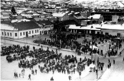
Слика 4а Житна пијаца (око 1950. године)

... трг као јавни градски простор постаје мотив одређеног планског хтења, не само у шемама идеалних градова, већ и мотив око којег ће се груписати јавни и значајни објекти у граду. 34