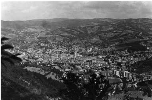
Слика 6 Титово Ужице , панорама око 1965. године

У непосредној околини Трга партизана се налази планина Тара на којој и данас расте Панчићева оморика. Архитекта, желећи и на тај начин да укључи локално наслеђе из области флоре, простор испред Народне библиотеке је резервисао за поменути биљку.