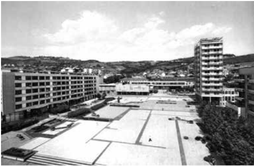
Слика 4б Трг партизана (око 1970. године)