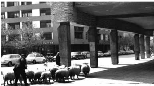
Слика 5 Трг партизана , трем Народног позоришта (око 1970. године)

Да ли је град требало – његове кућерке, претворити у музеј, преко четрдесет и шест регистрованих и законом о заштити знамења. 36