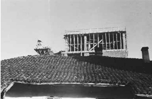
Слика 3 Трг партизана , изградња нових објеката и стара градска структура

наших градова, напореда са променом привредне структуре градова у изразито индустријско-занатску. 32