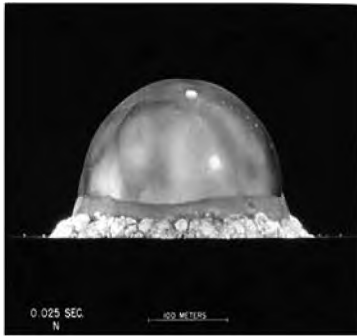
Слика 1 Прва атомска експлозија

У стварности, са крајевима разних живота се срећемо практично свакодневно од када је таблоидно новинарство у спрези са дигиталном технологијом легализовало снаф филмове и на насловним страницама сајтова нам понудило снимке различитих смрти снимљених безбројним камерама широм планете. А камера је заиста безброј: налазе се на нашим телефонима, на компјутерима, на раскрсницама, у продавницама, банкама, поштама, општинама, школама... Живот водимо несвесни да се он малтене константно документује и архивира.