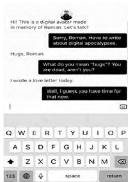
Слика 2 A Digital Avatar, app by Luka, Inc. ( https://searchman.com/ios/app/us/958946383/en/luka-inc/roman-mazurenko/)