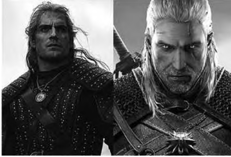
Слика 3 Веиштац у Нетфликсовој серији и Веиштац у истоименој игри, (илустрација: Fansided, https://winteriscoming.net/2019/07/25/netflix-witcher-adapting-books-not-video-games-lauren-hissrich/ )

продати у 33 милиона примерака, што је одличан резултат јер је просечна цена таквог типа игара око 50 долара, тако да причамо о износу већем од милијарду долара.