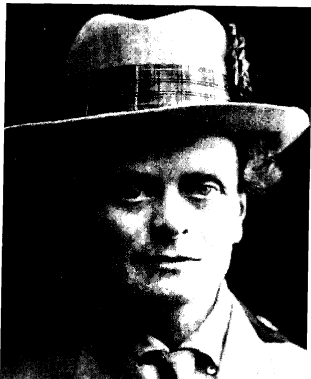
Slika 1. Dr Elsi Inglis u zvaničnoj uniformi komandanta "Bolnica škotskih žena", snimljena početkom 1915. g.

Tokom svoje lekarske prakse dr Inglis je pred sobom uvek imala jedan važan cilj, a to je uspo-