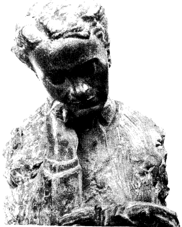
Slika 3. Bista dr Elsi Inglis koju je izradio poznati vajar Ivan Meštrović, a koja se kao poklon srpskog naroda nalazi u Nacionalnoj galeriji portreta Škotske u Edinburgu Fig. 3. Bust of Dr. Elsie Inglis made by famous sculptor Ivan Meštrović, which is exhibited, as a gift of the Serbian people, in the Scottish National Portrait Gallery in Edinburgh

Kratko vreme pre svoje smrti dr Elsi Inglis je saznala da su žene starije od 30 godina konačno