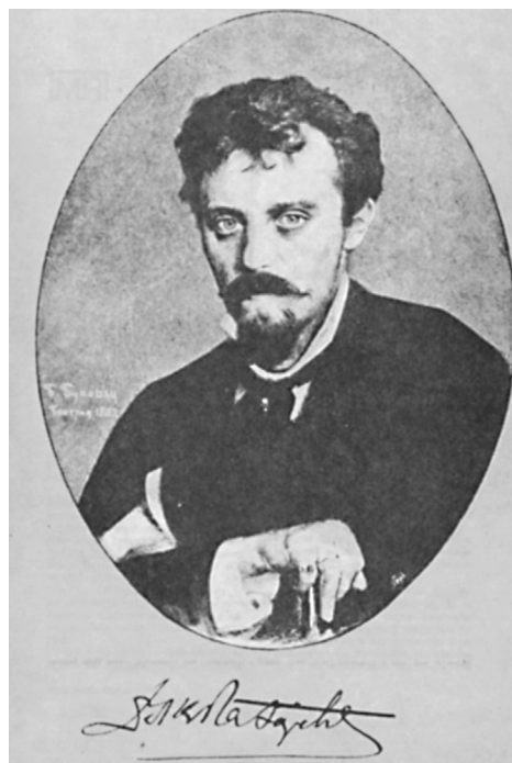
Fig. 1. Portrait of Laza K. Lazarević (may 13, 1851. Šabac-January 11, 1891, Belgrade) painted by Vlaha Bukovac, an academic painter, in Belgrade 1882

Slika 1. Portret Laze K. Lazarevića (13. maj 1851. g., Šabac - 11. januar 1891. g., Beograd) akademskog slikara Vlaha Bukovca, Beograd, 1882. g.