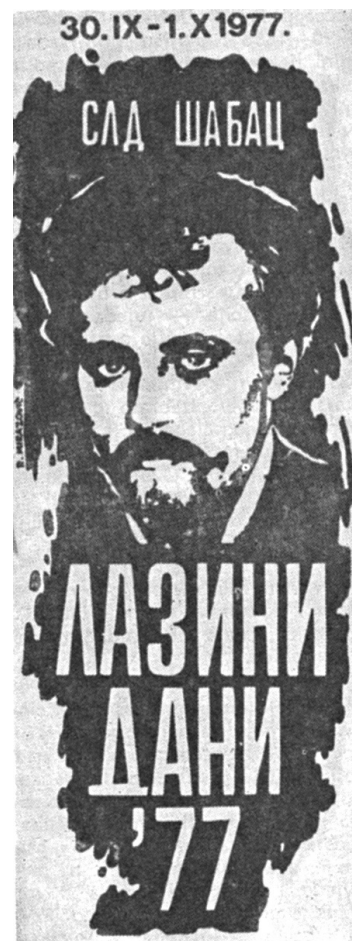
Slika 3. Plakat Prvog stručnog sastanaka lekara Podrinsko-Kolubarskog regiona Srpskog lekarskog društva Podružnice Šabac - Lazini dani '77, 30. septembar - 1. oktobar 1977. Šabac, održani u spomen na dr Lazu K. Lazarevića

Fig. 3. The poster of the first meeting of doctors from Podrinjsko-Kolubarski region organized by the Medical Society of Serbia, Branch of Šabac under the name "Laza's days '77" from September 30 to October 1 1977 in Šabac to commemorate Dr Laza Lazarević