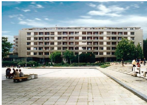
Слика 7 - Западни блок на Тргу Партизана, источни изглед (1961)

скелета објекта (као у северном тракту блока). Затворени делови приземља обликовањем и материјализацијом подржавају идеју о слободном приземљу тако да су површине под стаклом повећане док су зидане површине сведене на најмању потребну меру. Парапет је обложен керамичким плочицама док су стаклене површине у металном раму.