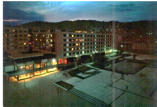
Слика 9 - Западни блок на Тргу Партизана, источни изглед (1961)

трокрилни прозори док су испред ниша и купатила мали прозори са наглашеним прозорским оквиром специфичне форме.