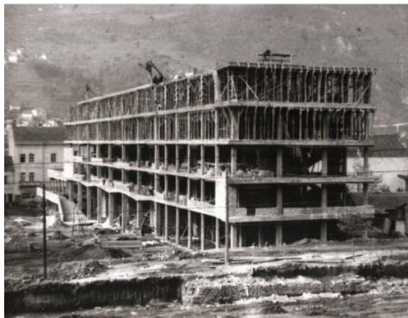
Слика 4 - Западни блок на Тргу Партизана, током градње, североисточни изглед (1960)

обrade фасада и опреме станова због посебни урбанистичких услова изградње објеката у оквиру трга...“.