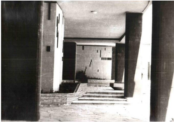
Слика 8 - Западни блок, детаљ улаза у степенишне вертикале (1960)

Са источне стране ова фасада је обележена са вертикалом лођа са оградом обрађеном на специфичан начин. Са западне стране фасада се завршава затвореним пољем које је на свакој етажи перфорирано са малим прозорским отвором који има специфично обликован прозорски оквир. Композицију завршава повучена етажа поткровља која се веома тешко сагледава са простора улице Краља Петра.