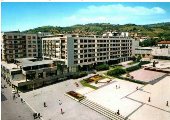
Слика 2 - Западни блок на Тргу Партизана, југоисточни изглед (1961)

јужног дела блока), пасажи за приступ степенишним вертикалама, изложбена дворана (у тракту према улици Краља Петра).