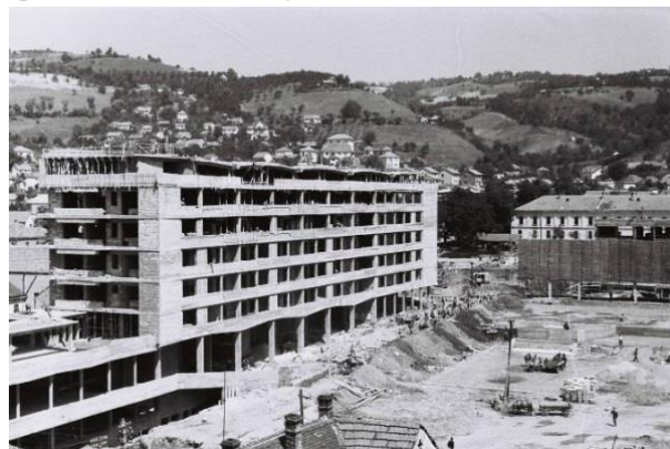
Слика 5 - Западни блок на Тргу Партизана, током градње, југоисточни изглед (1960)

кречени, а преграде између остава од чамових летова. Склоништа су у потпуности обрађена према тада важећим прописима. Хидроизолација се састоји од 2 слоја тер папира, 1 слој јуте, 4 премаза и заштитни слој од глине дебљине 10-12 cm са додатком система дренажних цеви које су повезане са градском канализацијом.