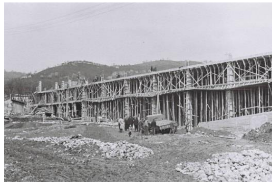
Слика 3 - Западни блок на Тргу Партизана, током градње, источни изглед (1960)

има 9 (5,7%) и атељеа има 1 (0,6%). Укупна има 160 стамбених јединица.