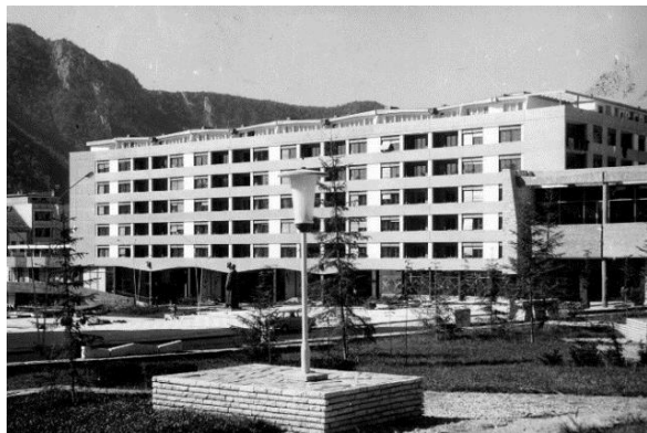
Слика 6 - Западни блок на Тргу Партизана, источни изглед (1961)

Намеће се утисак тежине и масе која се постиже избором материјала и површинском обрадом.