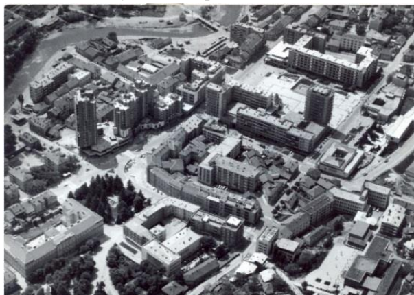
Слика 10 - Западни блок на Тргу Партизана, положај у граду (1961)

Детаљи обликовања су разноврсни и веома промишљено лоцирани и обликовани. Највише су лоцирани на оградама лођа, степенишним светларницима и посебно пажљиво обликовани у зони пасажа приземља између централног платоа и дворишта блока. Начињени су од дрвета, метала и претежно су варијације на тему квадрата који је у равни или са испупченим средиштем.