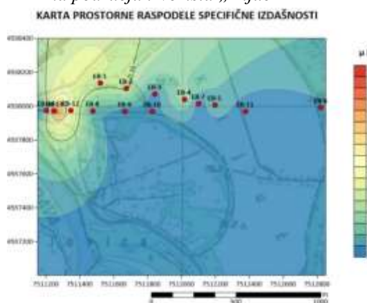
Slika 3 - Karte prostorne distribucije vrednosti specifične izdašnosti izdani na području izvorišta „Ključ“

U pogledu prostornog rasporeda vrednosti koeficijenta transmisivnosti, jasno se može videti da su najveće vrednosti u jugoistočnom delu izvorišta (bunari EB-14, EB-12, EB-10), dok idući ka severoistoku vrednosti opadaju. Vrednosti koeficijenta filtracije se povećavaju u severnom delu izvorišta. Vrednosti specifične izdašnosti najveće su u istočnom delu karte oko bunara EB-12 dok u severnom delu skoro da padaju na nulu. Navedeno predstavlja posledicu