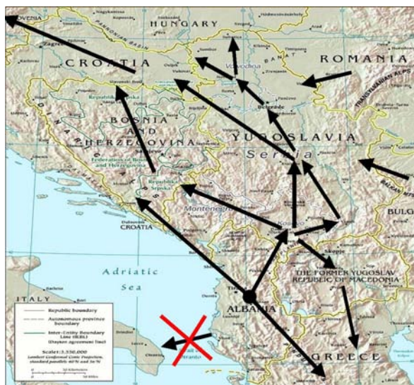
Слика 5 – Путеви кријумчарења дроге на Западном Балкану

Могућности за супротстављање трговини наркотицима налазе се у тесној сарадњи безбедносних служби и тужилаштва земаља региона. Неки од облика сарадње представљају и билатерални уговори о сарадњи тужилаштва за организовани криминал закључени 2010. и 2011. године између Србије, Хрватске, Црне Горе и Македоније.