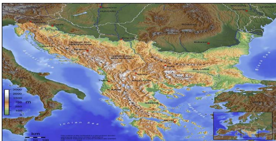
Слика 1 – Географска карта Балкана

„племенска непријатељства” често била подстицана од неуких дипломата из далеких центара који су стварали државе, делили народе и прекрајали границе – са смртоносним последицама. Западњаци, генерално лоше обавештени о балканским питањима, одушевљени су, али понекад и заплашени Балканом. Ипак, Балкан, као посебна мешавина народа и вера, са великом културном, етничком, верском, друштвеном, привредном и географском разноврсношћу, има другу примамљиву, непознату страну, која га чини узбудљивом дестинацијом за уживање, са древним налазиштима, највећим остварењима средњовековног и оријенталног градитељства, као и изванредним сведочанствима владавине Хабзбурга, јединственом балканском гастрономијом, што све скупа чува наизглед непромењени дах прошлости.