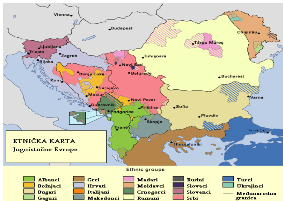
Слика 3 – Етничка структура

Како се већина држава на простору Балкана још увек налази у фази постсоцијалистичке транзиције и опоравка након оружаних сукоба, а има за прокламован циљ достизање демократских вредности савременог друштва, јасно је да су још увек присутни безбедносни ризици. То пре свега јер на релативно малом простору живи десет народа и више етничких група (припадника три највеће конфесије), са још увек присутним осећањем појединих народа да им је учињена „неправда“ после разграничења државних територија под утицајем великих сила. Етничка структура и испреплетаност животног простора најбоље се види на слици 3. 4