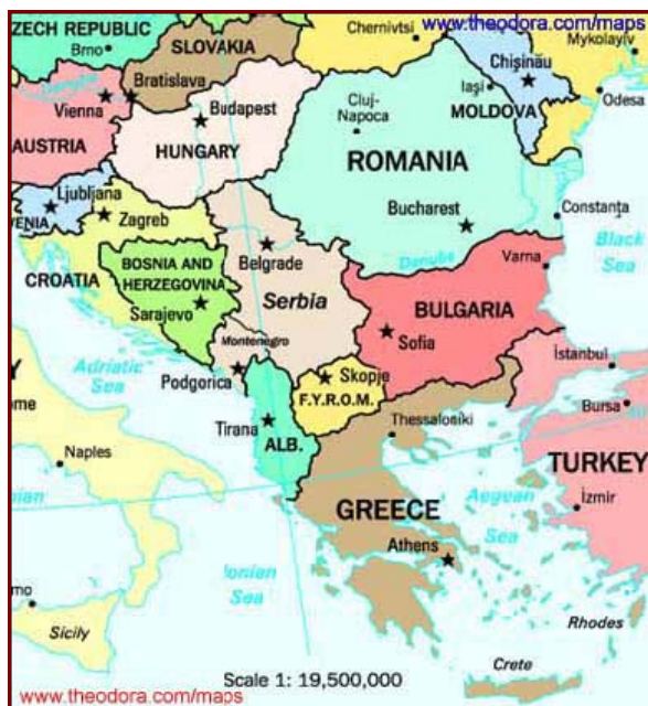
Слика 2 – Политичка карта Балкана

Промене у Источној Европи и бившем СССР-у извеле су на историјску сцену низ супротности и интереса који су у ранијем периоду били мање или више контролисани, попут међунационалних односа, граничних питања, положаја националних мањина и сл. У контексту такве стварности отпочели су процеси европских интеграција, у средишту којих је Европска унија, али и распад бивше Југославије и неких држава источног блока.