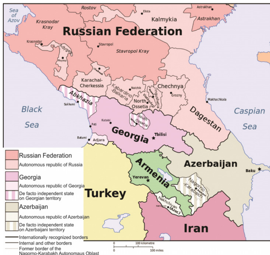
Карта 2 – Закавказје 45

Европска унија суштински није јединствена по питању Украјине, а истовремено Сједињене Америчке Државе настоје да управљају дестабилизацијом Украјине и буду медијатор у том процесу. Дугорочно, питање Украјине се промовише као камен спотицања и извор сукобљености ЕУ и Русије, а такав развој ситуације нанео би највеће последице првенствено европским и азијским државама. У глобалној стратегији надметања, Немачка и Русија биле би изложене највећим последицама. Међутим, изгледа да су обе земље свесне тога и вуку промишљене и прагматичне политичке потезе.