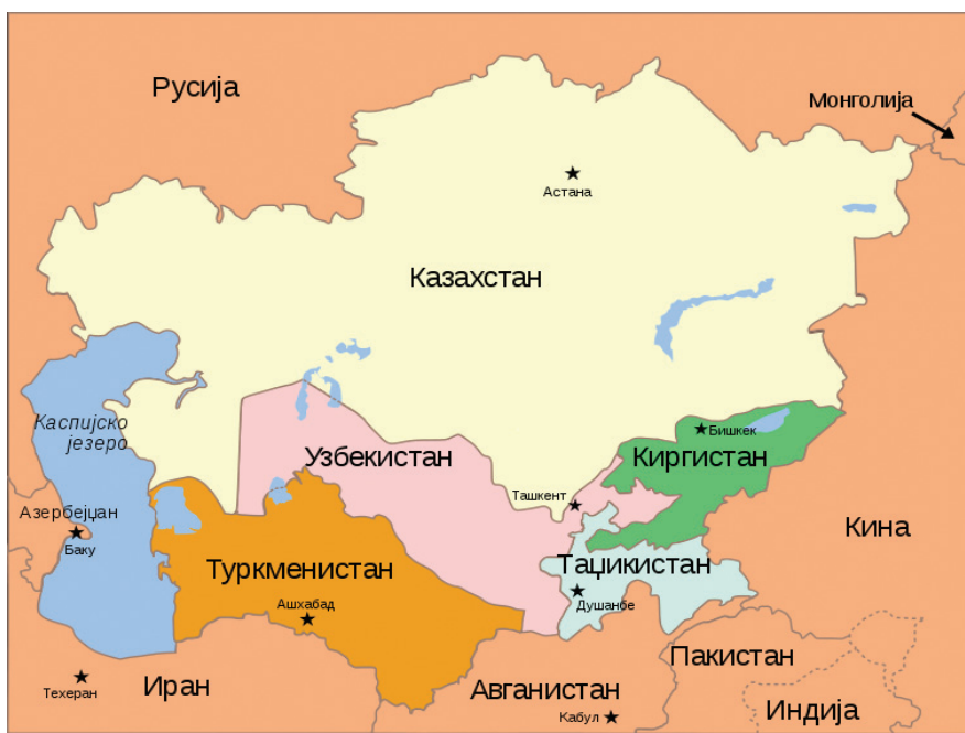
Карта 1 – Политичка мапа Централне Азије 20

У постојећим околностима Централна Азија за САД представља стратегијски важну област због борбе против тероризма, али пре свега због огромних залиха нафте и природног гаса које се налазе на том простору. Једанаести септембар и, након тога, рат у Авганистану довели су Централну Азију у жижу међународне пажње, наглашавајући њен стратегијски значај за Запад као „геополитичку осовину“ огромне евроазијске масе. 21 Ипак, треба поменути да су САД, у периоду од 1922. до 1991. године, када су, данас самосталне државе централне Азије биле интегрални део СССР-а, имале врло мало или нимало додира са њима и да је, стога, америчко виђење овог простора било прилично „замагљено“, те су се 1991. године суочиле са изазовом да изграде односе са земљама са којима претходно нису много сарађивале.