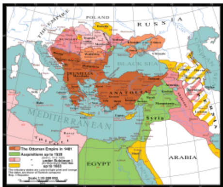
Teritorijalno širenje Otmanskog Carstva na Evropu, Aziju i Afriku između 1481. i 1683.

Први Османлија који се прогласио за султана био је Мурат I. После освајања Цариграда, 1453. године, држава постаје моћно царство са Мехмедом II Освајачем као царем. Свој врхунац царство достиже под владавином Сулејмана I у 16. веку када се простирало од Персијског залива на истоку до Мађарске на северозападу, и од Египта на југу до Кавказа на северу. На врхунцу моћи царство је заузимало територију од 11.955.000 km 2 .