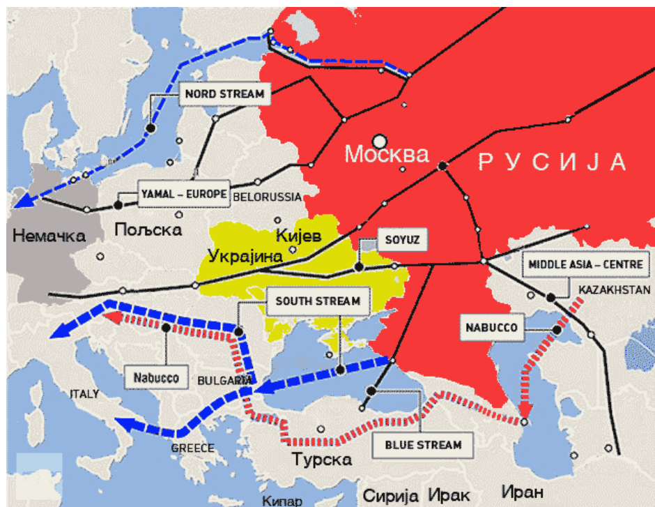
Руски гасоводи и Набуко 16

На тај начин руска влада, која је 2005. године повратила статус већинског власника у „Гаспрому”, настоји да обезбеди политичке, економске и безбедносне интересе на територијама за које сматра да су њена интересна сфера. Русија тако, преко свог агента „Гаспрома” проширује свој утицај, што је много софистициранија стратегија него да једноставно прикаже, а самим тим и угрози, своје стварне намере и далекорочне глобалне амбиције. Ипак, помоћу потеза извршне власти, јасно