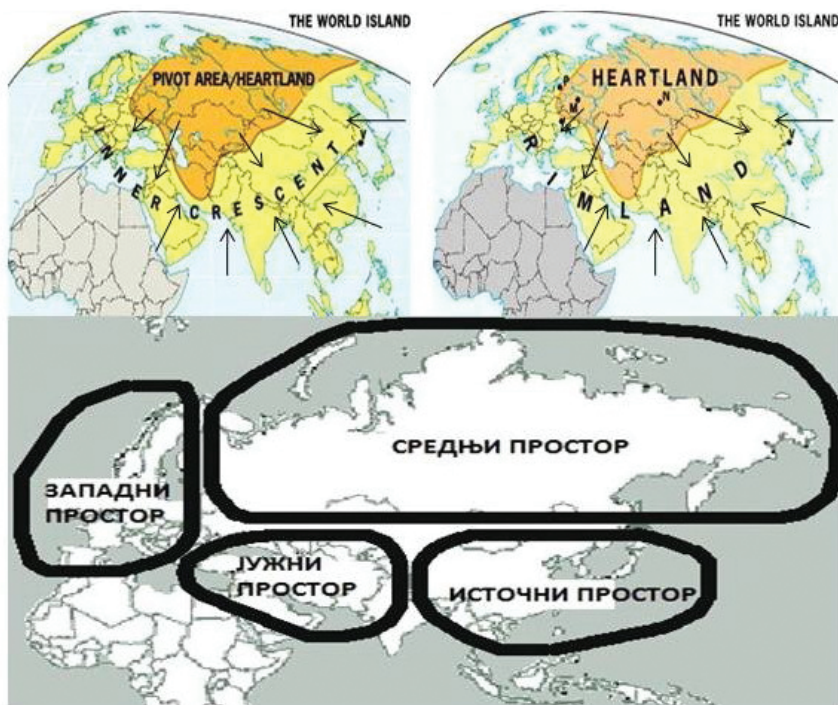
Слика 2 – Просторни приказ геополитичких теорија планетарне двојности 40

То гранично подручје сталног надметања „сила мора и копна” према Макиндеру чини појас тзв. „унутрашњег” или „периферног полумесеца” ( Inner or Marginal Crescent ), који се подударе са приобалним деловима евроазијског континента. Преко тог појаса „силе копна” из средишта света настоје да се домогну отворених мора, а „силе мора” да преко њега контролишу ривалску страну. Овај појас окружује тзв. „Светско острво” ( World Island ), копнени простор Евроазије, чији се централни, стожерни део ( Pivot Area ), односно средиште, срце света ( Heartland ), налази у централном делу евроазијског масива, што суштински представља територију данашње Русије.