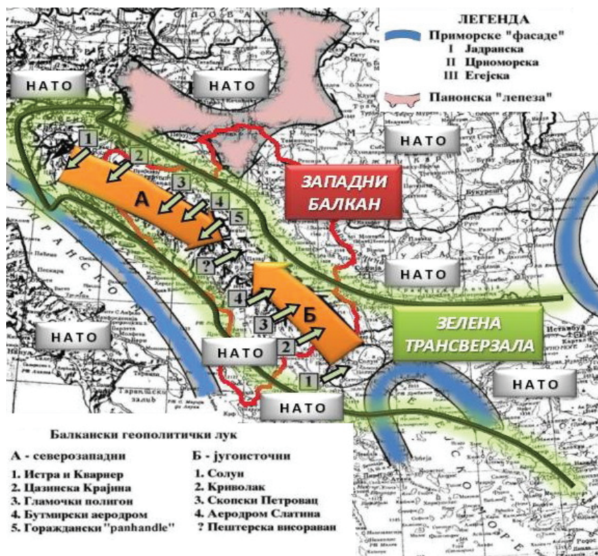
Слика 5 – Балкански геополитички и геостратегијски лук на правцу простирања „Зелене трансверзале” 59

лазила у снажном упоришту НАТО-а унутар Егејског басена, Солунског залива и Солуна, а две тачке ослонца су у Македонији инсталиране на полигону Криволак и аеродрому Скопски Петровац. Тачка која би била идеалан гарант стабилне запоседнутости КиМ-а, чврстине и продужавања лука према северозападу идентификована је на аеродрому Слатина код Приштине, како би, због важности косовско-метохијског простора, његове латентне нестабилности, безбедности америчких трупа и сектора у којем су распоређене, те контроле качаничке проходнице према запаљивом појасу дуж Скопске Црне Горе, јужне подгорине Шар-планине и Полошке котлине, било формирано још једно упориште – база Бондстил. 58