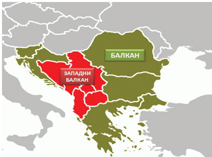
Слика 1 – Простор Западног Балкана унутар Балкана

вавих сукоба, „Западни Балкан” и даље представља специфичан простор услед својих политичких, економских и безбедносних карактеристика. Очигледно, реч је о недефинисаном политичком простору на којем су се у блиској прошлости одвијали оружани сукоби, а политичко-безбедносна ситуација ни данас није стабилна.