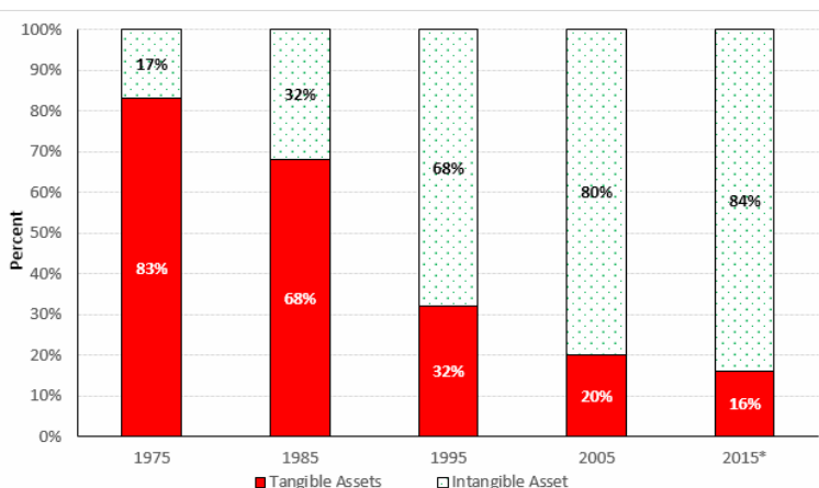
Slika 1 – Odnos materijalne i nematerijalne imovine u ukupnoj tržišnoj vrednosti 500 kompanija SAD u periodu 1975–2015.

Doba industrijalizacije dostiglo je svoj vrhunac i faktori na kojima je počivala dotadnja uspešnost ekonomija nisu više bili dovoljni. Industrijsko doba zamenilo je postindustrijsko doba u kojem je proces globalizacije „smanjio svet” i nametnuo svima niz novih izazova u poslovanju. Kompanije sada mogu da pobeđuju (ili da gube) u tržišnom takmičenju ne samo na osnovu kapitala koji poseduju nego i na osnovu onoga što znaju.