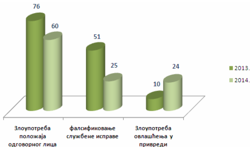
Слика 3 – Упоредни приказ најзаступљенијих кривичних дела привредног криминалитета

– по једно кривично дело – злоупотреба права из социјалног осигурања, фалсификовање знакова за вредност, прибављање, набављање и давање другом средстава за фалсификовање, обмањивање купаца, ненаменско коришћење буџетских средстава, трговина утицајем, примање мита и чл. 57 Закона о девизном пословању.