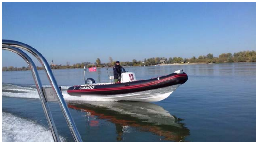
Слика 2 – Гумени чамац са чврстим трупом типа RIB 720 – CANDO

Кинески чамац CANDO, RIB серије модел 720, опремљен са ван бродским четворо цилиндричним бензинским мотором, модел Јатаха F150FET 6 ВМХ, добијен као донација Народне Републике Кине. Дизајниран је и саграђен на платформи RIB чамца, где је чврсти труп израђен од стаклопластике, а бокове чамца чине пето коморни тубус од PVC материјала. Палуба је водонепропусна и израђена је од стаклопластике. Уколико се на дну чамца сакупи већа количина воде (услед продора воде и сличног) укључује се дренажна пумпа, која се налази у крменом делу (слика 3).