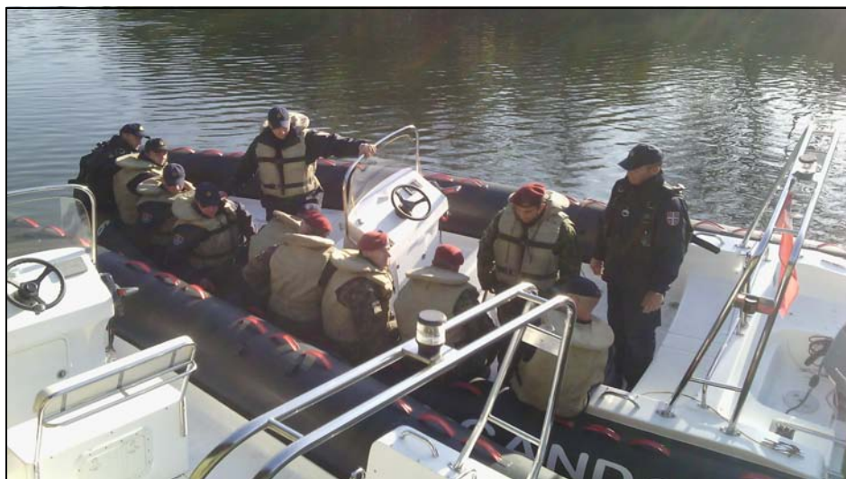
Слика 5 – Тестирање стабилности чамца

Не потопивост је такође једна од карактеристика овог пловила која се обезбеђује херметичношћу спојева и разних отвора на његовом трупу, дренажном пумпом али пре свега ваздушним коморама у облику тубуса који је уграђен уздуж чамца. Такође, решење да се ваздушни тубус направи од пет засебних комора додатно утиче на непотопивост чамца јер се на тај начин умањује ефекат његовог евентуалног пробијања или пуцања где се због осталих, неоштећених, секција задржава пловност.