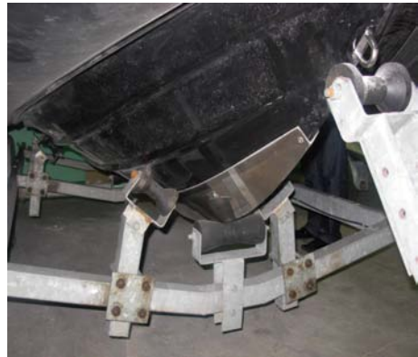
Слика 9 – Предлог ојачања прамчаног дела чамца

Овом модификацијом труп чамца, који је израђен од стаклопластике, био би додатно заштићен приликом пристајања на обалу. Ојачање треба извести тако да не нарушава његове хидродинамичке карактеристике.