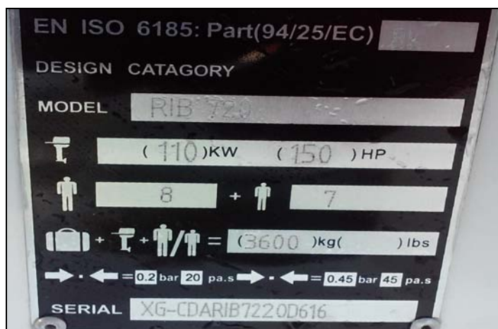
Слика 6 – Натписна плочица

Међутим, током тестирања које су спровели представници Техничког опитног центра Војске Србије у сарадњи са Речном флотилом установљено је да чамац има места за укупно чак 13 одраслих путника, а уколико би 2 путника седела на тубусима лево и десно у крменом делу чамца, онда би у чамац могло да се смести и 15 одраслих путника (слика 7).