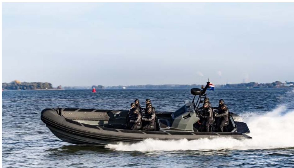
Слика 1 – Гумени чамца са чврстим трупом 2

Флексибилни гумени тубус је део чамца чија је основна намена да обезбеди додатну пловност, не потопивост и стабилност. Израђује се у секцијама како би се умањио ефекат евентуалног пробијања или пуцања где се због осталих неоштећених секција задржава пловност чамца. Свака секција поседује вентил за убацивање или избацивање ваздуха из тубуса. Израђује се од следећих врста материјала: хипалона у комбинацији са неопреном, ПВХ-а, полиуретана или полиамида. Због карактеристика материјала од којег се израђује омогућена је флексибилност и еластичност тубуса чиме се на врло једноставан начин решио проблем компромиса између максималне брзине и екстремних маневара са једне и потребне стабилности чамца са друге стране.