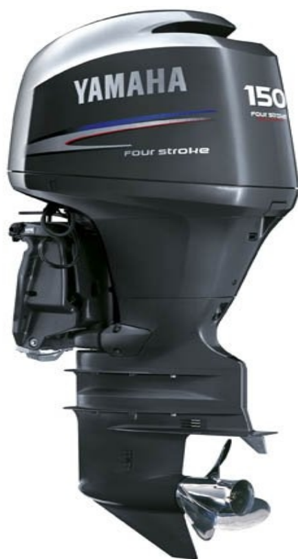
Слика 4 – Ван бродски мотор типа Yamaha

Стабилитет је способност супростављања нагињању брода које може бити изазвано силама као што су: ветар, таласи, неравномерно распоређен терет, центрифугална сила која настаје услед окретања брода итд. Жељени стабилитет брода се постиже пре свега конструкцијским решењима. Што је ширина у односу на дужину трупа већа, то ће стабилитет и способност супротстављања превртању такође бити већи, али до одређене границе јер се повећањем ширине губи на брзини брода 3 . Проблем усклађивања ових конфликтних захтева, потребе за великом брзином са једне и стабилности пловила са друге стране, код RIB чамаца, решен је на тај начин што се додатни стабилитет добија уздужном уградњом флексибилних тубуса, чиме је добијена потребна ширина у односу на дужину чамаца, али тако да се отпор чамаца не повећава у знатној мери како би се задржала максимална жељена брзина пловидбе.