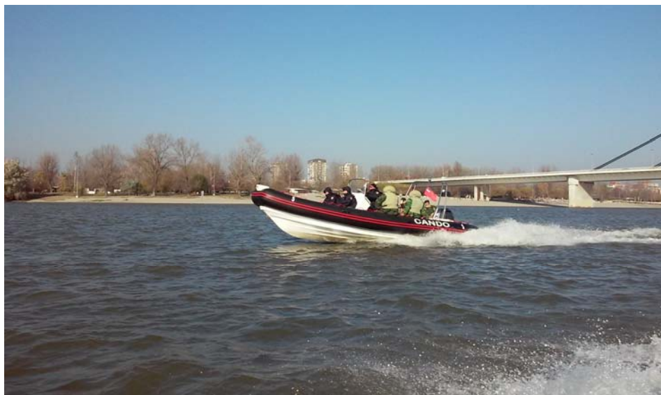
Слика 8 – Распоред путника

У оба случаја оптерећења, чамац је изглисиравао (прелазео из депласманског у глисерски режим пловидбе) при брзини: V_{izg} = 33 \text{ km/h} (17.8 kn).