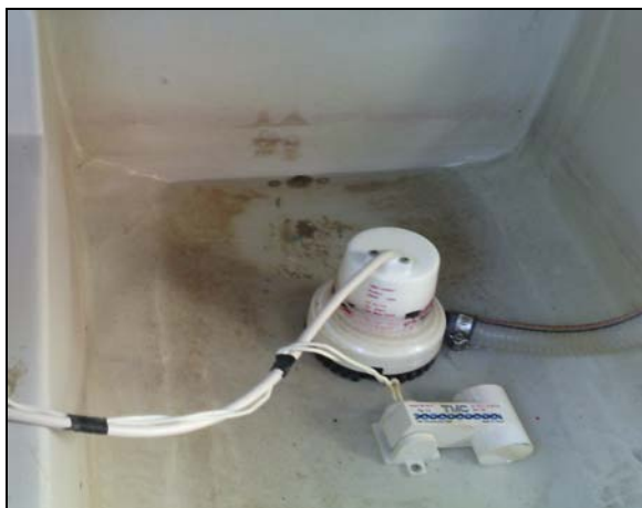
Слика 3 – Дренажна пумпа