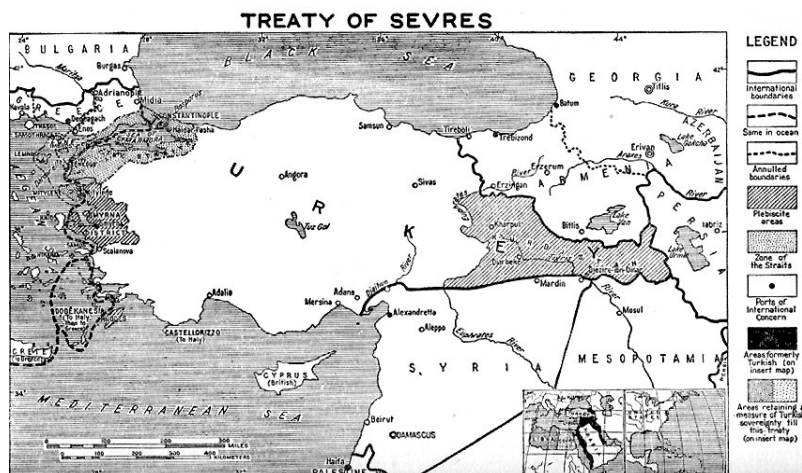
Слика 2 – Саставни део споразума у Северу – Мапа Турске са аутономијом Курдистана 21

Ипак, због великих територијалних губитака Турске, као и неслоге Курда око тога ко ће владати Курдистаном, овај споразум није прихваћен и није заживео, а у следећем и коначном споразуму Турске са коалицијом Антанте, који је потписан јула 1923. године, Турској су враћене територије и држава је добила садашње границе, без аутономних области (слика 3).