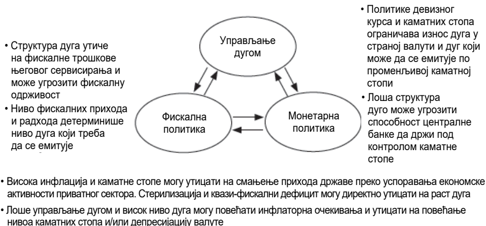
Слика 3 – Јавни дуг, монетарна и фискална политика, интеракција

Уколико се држава задужује у иностраној валути, повећава изложеност земље девизном ризику, повећава притисак на девизни курс, подгрева инфлаторна очекивања и тиме уноси знатну дозу неизвесности у привреду, чиме директно опредељује ниво аутопута, а тиме и ниво прихода и издатака буџета. Са друге стране, уколико се држава финансира на домаћем финансијском тржишту и знатно повећава домаћу компоненту јавног дуга, доћи ће до пораста општег нивоа каматних стопа, смањиће се износ средстава које пословне банке могу ставити на располагање привреди, инвестициона активност ће такође бити мања, а тиме и ниво производње, чиме се индиректно утиче на стање буџетског дефицита у наредном периоду ( crowding out effect ). Задуживање у иностранству, осим повећања изложености земље девизном ризику и последица које собом носе растуће девизне обавезе, приморава централну банку да предузима рестриктивне мере (попут стерилизације девизних прилива), чиме се на крају опет утиче на расположив ниво средстава за финансирање привреде, ниво привредне активности и стање буџета.