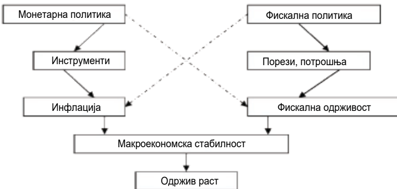
Слика 2 – Утицај монетарне и фискалне политике на привредни раст

Фискална политика утиче на монетарну, пре свега начином финансирања буџетског дефицита (политиком јавног дуга) и висином државних издатака. Уколико држава финансира мањак у буџету путем тржишних инструмената, постоји опасност од истискивања привреде са домаћег финансијског тржишта и обарања инвестиционе активности (раст каматних стопа), што резултира падом производње и додатним притиском на буџет. Уколико се државни дуг финансира из иностранства повећава се девизни ризик, ризик платно-билансног погоршања, креира притисак на девизни курс и подгрева инфлаторно очекивање. Све то подрива ценовну стабилност и мере монетарне политике. Токови новца повезани са државним финансирањем имају одлучујући утицај на ликвидност тржишта новца, девизни курс и стабилност финансијског тржишта, а све се рефлектује на квалитет привредног амбијента, обим производње и фискалну позицију земље.