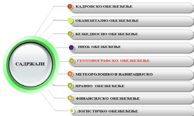
Figure 1 – The geo-topographic support in the Serbian Armed Forces support system

Therefore, according to the Operations Doctrine of the Serbian Armed Forces, "the support of forces in an operation is organized in a timely manner, continuously and completely, at all levels, in accordance with combat, weather and space conditions." 2