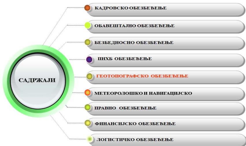
Слика 1 – Геотопографско обезбеђење у систему обезбеђења Војске Србије

Због тога се, према Доктрини операција Војске Србије, „обезбеђење снага у операцији организује правовремено, непрекидно и потпуно, на свим нивоима, сагласно борбеним, временским и просторним условима”. 2