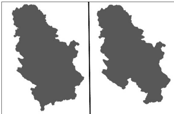
Figure 1 – Map of the Republic of Serbia with and without Kosovo and Metohija (edited by the authors)

public, would violate the naturally predetermined geopolitical and geostrategic potential of the macro fortress and would make Serbia vulnerable, especially the districts of Raška, Rasina, Toplica, Jablanica and Pčinja [Figure 1].