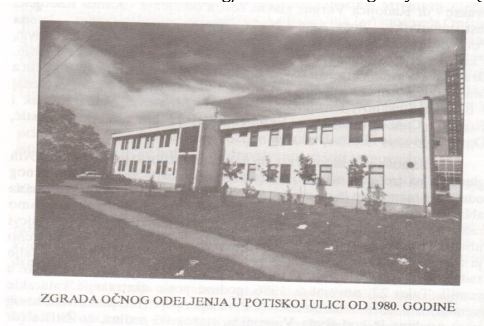
ZGRADA OČNOG ODELJENJA U POTISKOJ ULICI OD 1980. GODINE