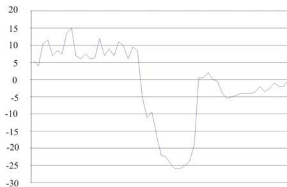
Sl.3b. Uzdignutost profila zemljišta na parceli 6