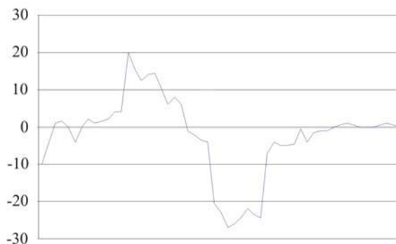
Sl.3a. Uzdignutost profila zemljišta na parceli 9

Da bi se ovo ostvarilo, veliku ulogu pri tome imaju konstruktivne osobine radnih organa oruđa, npr. kod raonih plugova forma plužne daske, prisustvo ili odsustvo pretplužnjaka... Kvalitet rada oruđa zavisi od blagovremenosti njihovog korišćenja i ispunjenja zadatih pokazatelja rada (dubine, stepena rastretitosti,...), od brzine kretanja, mehaničkog i strukturnog sastava zemljišta, njegove vlažnosti, a takođe i od karakteristika parcele u momentu izvođenja radova (prisustvo ili odsustvo busa, nepožnjevenih ostataka, korovske vegetacije...). Najveću vezanost imaju glinovita zemljišta u suvom stanju. Uzdignutosti zemljišnog profila za konkretne uslove prikazana je na slici 3a i 3b.