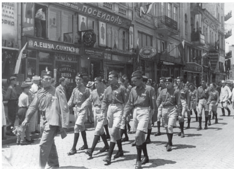
Слика 6. Соколи Смедерева у соколском дефилеу, Софија, 1939.

Крајем двадесетих и почетком тридесетих година 20. века, када је соколство било изузетно снажно на свим пољима свога деловања, почеле су се прихватати нове спортске активности у физичком вежбању и такмичењима. У Смедереву је одувек владао спортски дух, тако да су лако