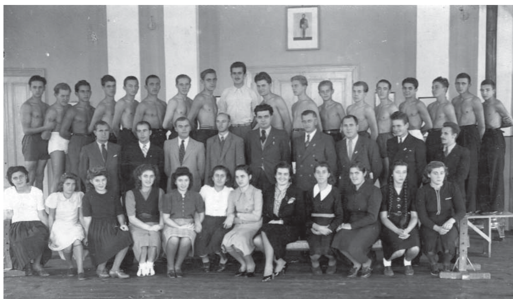
Picture 7. The Falcon Association of Smederevo, a part of the membership 1940