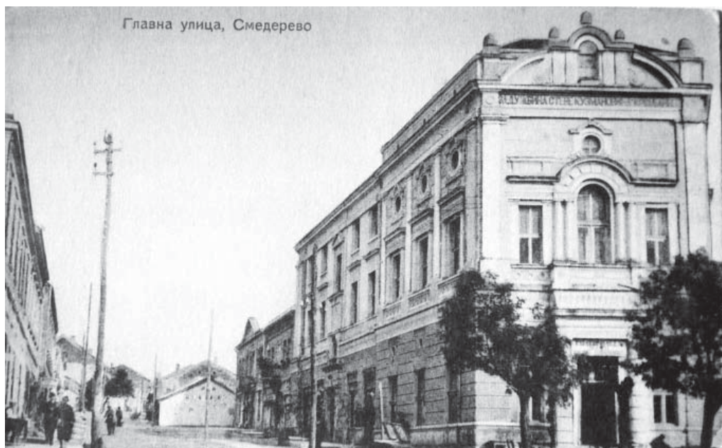
Picture 3. Falcon headquarters on the first floor of Zaduzbina building

maintenance of the gym. The house of falcons was located on the first floor of "Zaduzbina" where it had a spatial main and auxiliary gym, accompanying premises, falcon library and reading-room. In the gym of falcons, besides exercising the following was organized: dances, public classes, lottery, and collection of voluntary and humanitarian donations at falcons' evenings.