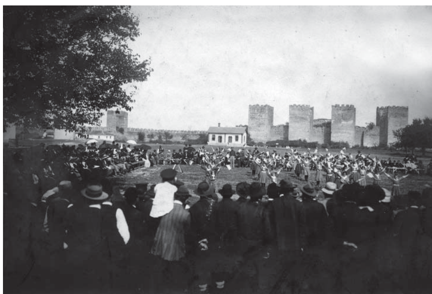
Picture 1. Falcon rally in Smederevo fortress, 1914