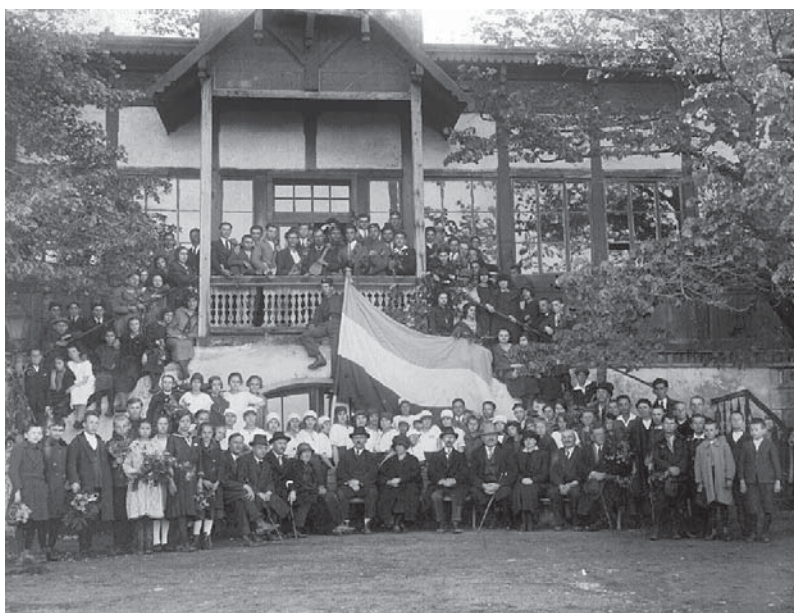
Слика 2. Уранак смедеревских сокола, испред Виле Обреновића, 1924.