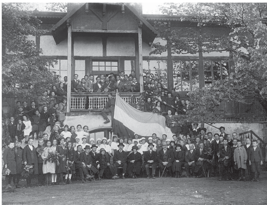
Picture 2. Smederevo Falcon reveille, in front of the villa Obrenovic, 1924