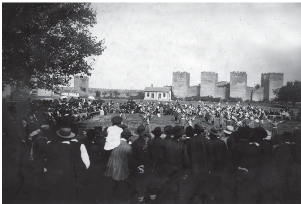
Слика 1. Соколски слет у Смедеревској тврђави, 1914.