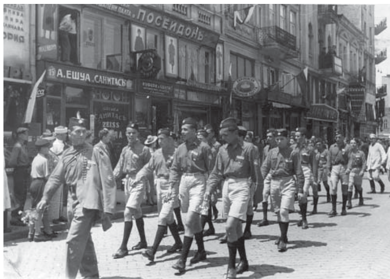
Picture 6. Smederevo Falcons in Falconry Parade, Sofia, 1939

At the end of twenties and the beginning of thirties of the last century, when falconry was extremely strong in all fields of its acting, new sports activities in physical exercising and competitions started being accepted. Sports spirit was always developed in Smederevo, so the mentioned changes in relations of sports and falcon unions were easily accepted. Smederevo was an example amongst towns for that. Thanks to the versatile orientation in the program of activities of the Association in Smederevo, it was highly ranked in Belgrade Falcon Parish (The Annual Reports for Main Assembly of Falcon Parish Belgrade Work for the Year 1937). Smeder-