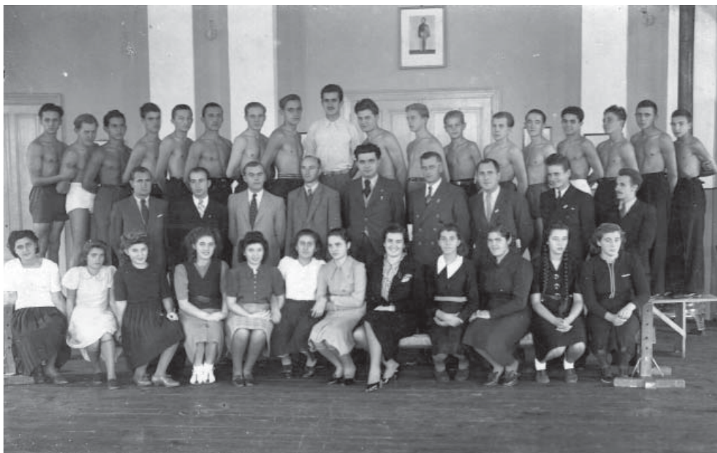
Слика 7. Соколско друштво Смедерево, део соколског чланства 1940.