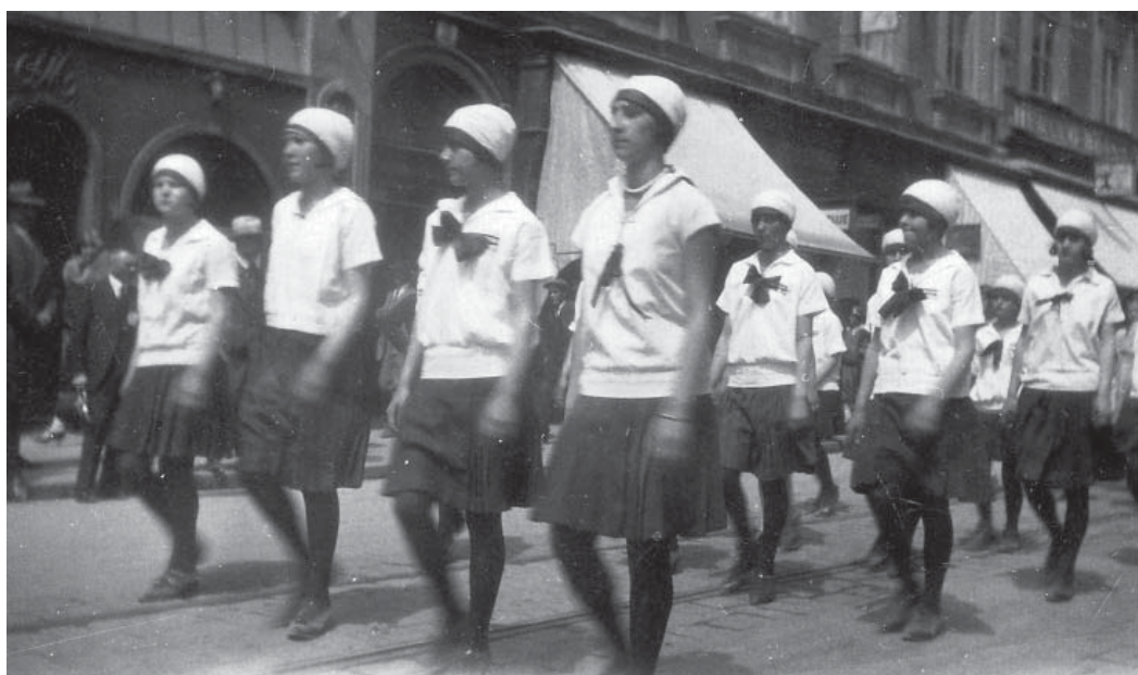
Picture 4. State champions of generation of Smederevo, Subotica 1936