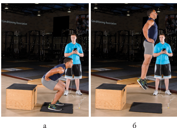
Figure 1 Variations of squat jump: a - starting position, b - maximum jump (Haff & Triplett 2016)

Squat jump is performed from a static position by lowering body from an upright position to a squat position with flexion in the ankle, knee (90° angle) and hip joint. This position participant holds for 2 to 3 seconds. Then the maximum jump is performed (Figure 1). This jump excludes the activation of the stretch and shortening cycle of the muscle, and the jump is accomplished only on the basis of concentric muscular contraction. Compared to the drop jump and the countermovement jump, the squat jump results in lower jump heights. This jump can be useful for sports and sports branches where eccentric contraction is not preceded, but concentric contraction is exerted from isometric conditions, such as swimming start from starting block, a block in volleyball, jumping under basket in basketball, ski jumping, etc.