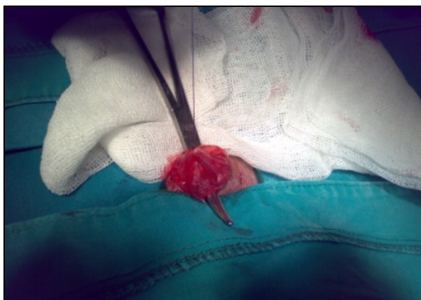
Slika 1. Izgled suture na proširenom pampiniformnom pleksusu

Pacijenti i resursi KBC Priština u Gračanici, KBC "Zvezdara" u Beogradu i Opšte bolnice Novi Pazar, u periodu 2005-2015 godine, selektovani po kriterijumima za infertilne parove i muški infertilitet-subfertilitet: Prisustvo varikokele, abnormalan spermogram, ginekološki status partnerke (uređan), minimum godinu dana zajedničkog života bez začeća. Svim pacijentima uradjena je ligatura pampiniformnog pleksusa, odnosno varikokele subingvinalnim pristupom u anesteziji čija vrsta je bila određivana u konsultaciji sa anesteziologom.