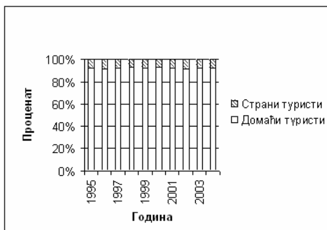
Слика 2. – Удео домаћих и страних туриста у %.

У прву групу спадају планинска туристичка места Златибор и Тара 14 и бања Ковиљача 15 . Висок степен посећености ових туристичких центара, последица је природно географских вредности, захваљујући којима представљају и примарне туристичке дестинације не само овог простора, већ и целе Србије.