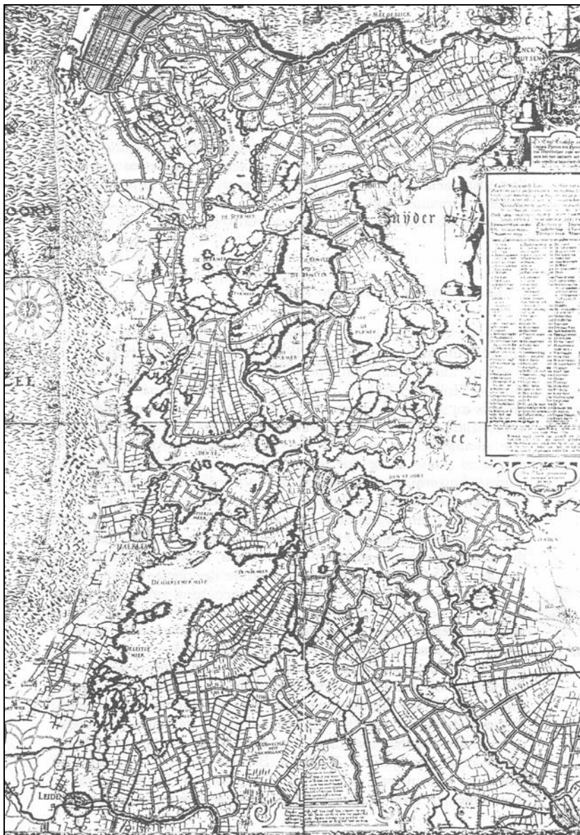
Слика 1. – Јанцова карта Северне Холандије из 1575. године (према Merlin, 2002)

тзв. Харлемског мора (око 18 000 ha) 1852. године, и то по први пут у организацији државе, а не само локалних становника 3 .