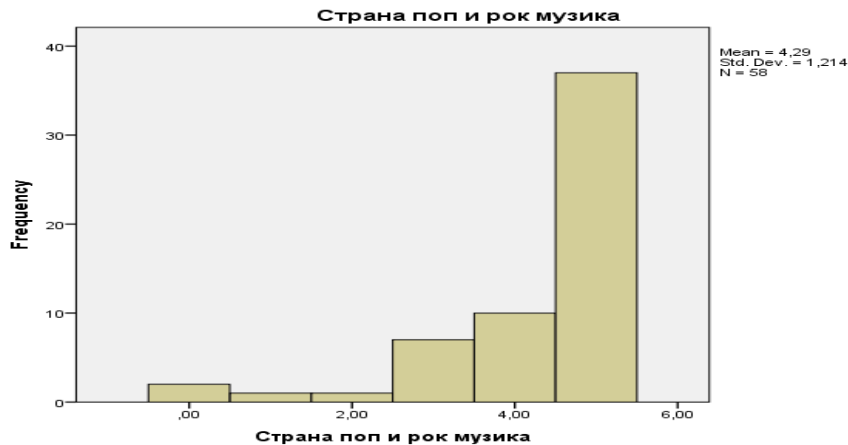
Хисторограм 1. Музичке преференције студената Училијској факултету из Београда који похађају предмет Енглески језик за децу уз песму и покрет, генерација 2017/18.