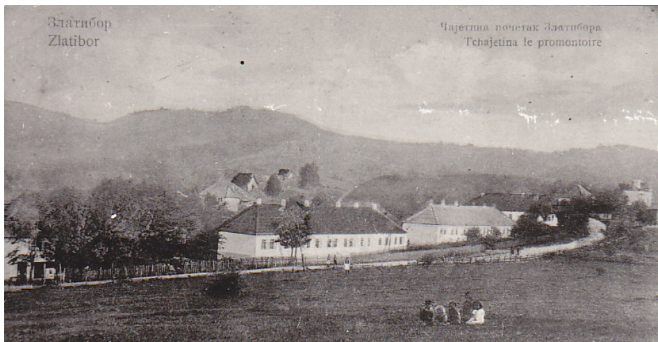
Слика 05. Чајетина, око 1920. године Figure 05. Čajetina, about 1920.