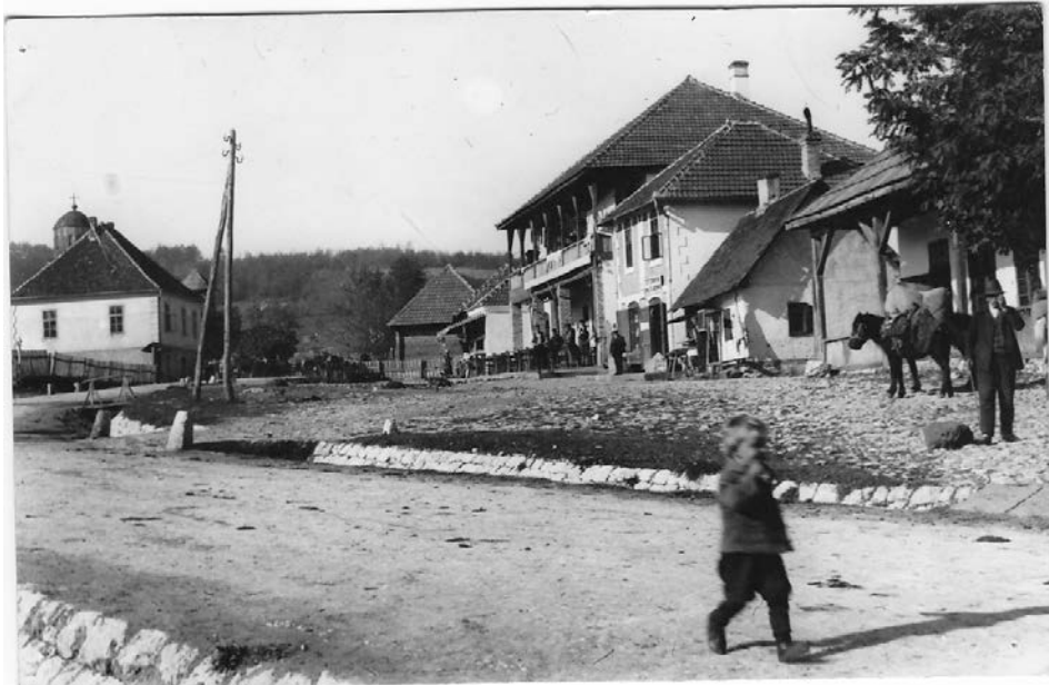
Слика 04. Чајетина, око 1920. године Figure 04. Čajetina, about 1920.