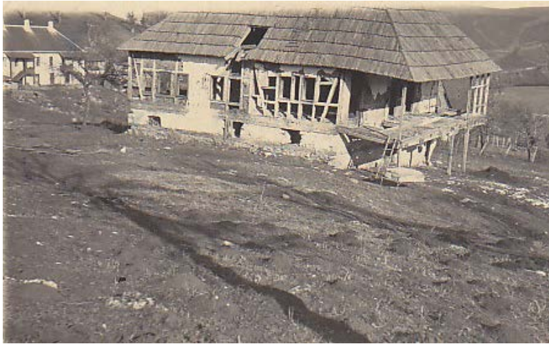
Слика 02. Конак сердара Јована Мићића саграђен почетком 19. века Figure 02. House of serdar Jovan Mičić built at the beginning of 19th century