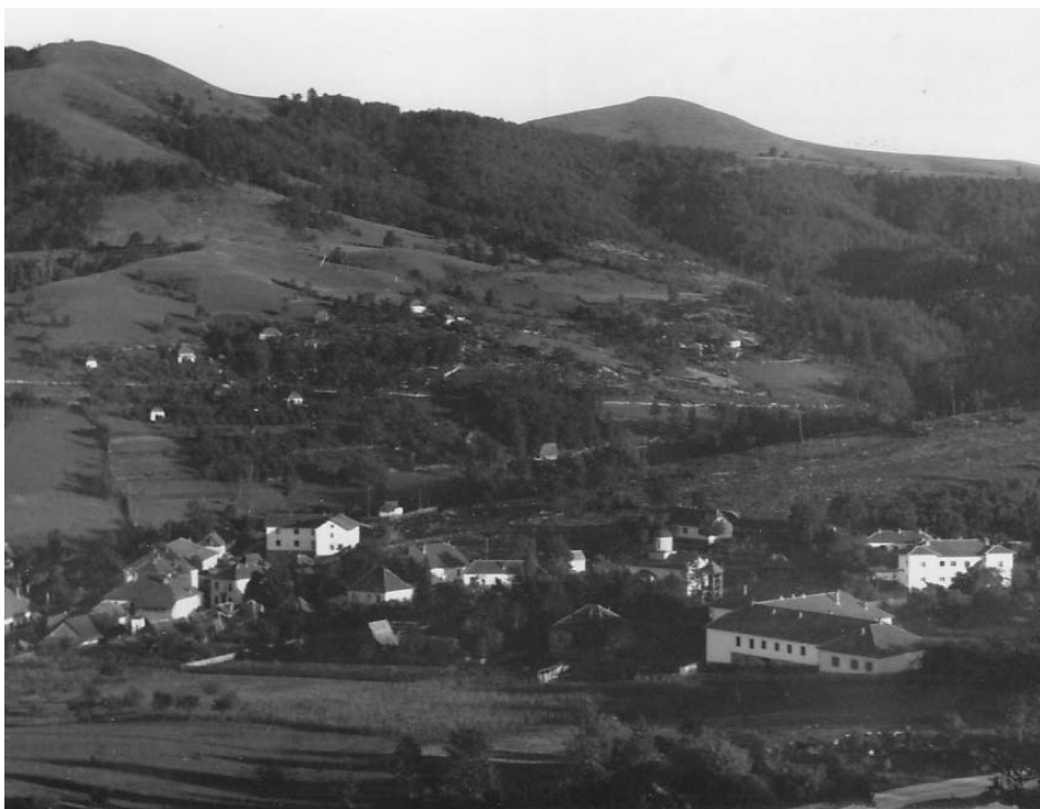
Слика 06. Чајетина, око 1950. Figure 06. Čajetina, about 1950.