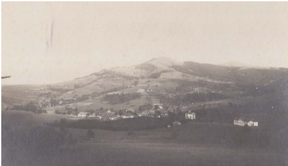
Слика 03. Чајетина око 1916. године Figure 03. Čajetina, about 1916.