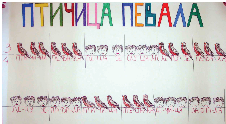
Primer br. 3. „Ptičica pevala”

Sledi primer brojalice „Ptičica pevala” u trodelnom taktu, sa istim ritmičkim trajanjima.