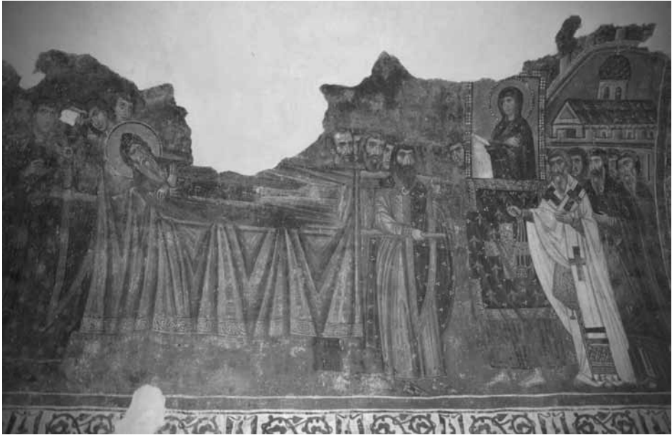
Сл. 5 Пренос моштију Свeйџої Симeонa, параклис Светог Симeонa, Сопoћани

У јужном параклису уз унутрашњу припрату цркве Свете Тројице у манастиру Сопоћани, фреске су делимично очуване (Ђурић 1963: 80, 82). На северном зиду параклиса налази се сцена Пренос Симеонових моштију из Хиландара у Студеницу (Сл. 5) која ликовно подсећа на истоимену сцену у Студеници. На њој се могу уочити портрети Вукана и Стефана, како носе одар са моштима и вероватно Саве, који је десном руком ухватио Вукана за мишицу (Ђурић 1964: 77). Тиме су представљена сва три брата како преносе очево тело у Студеницу.