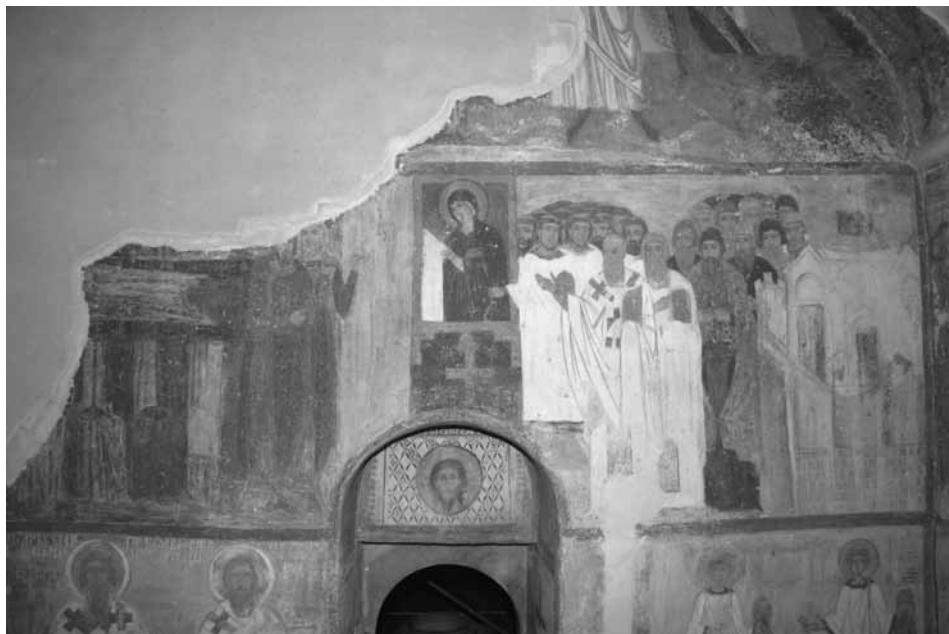
Сл. 4 Пренос моштију Свѣйої Симеона, јужна капела Радослављеве припрате, Студеница