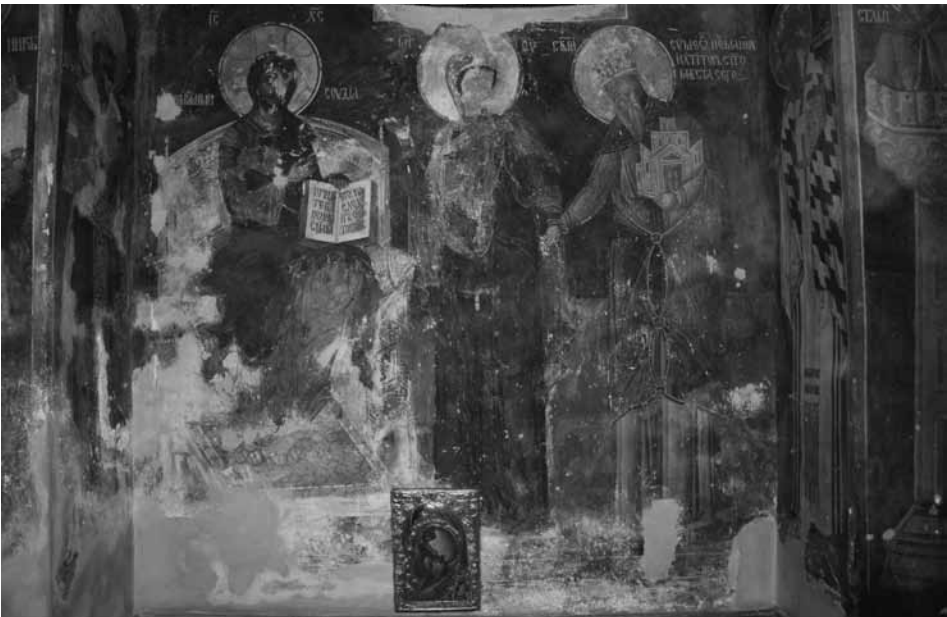
Сл. 2 Ктиторска композиција, Богородичина црква, Студеница ( https://www.blagofund.org/Archives/Studenica/Main/Pictures/Interior/Naos/Western_bay/South_wall/South_wall_-_first_row/STUD_2_IMG_7022.html , Приступљено 5. 9. 2020)

Уместо Светог Саве је, како се претпоставља, првобитно био приказан Стефан Првовенчани јер је Стефан Немања њему пренео ктиторска права над Студеницом, док је на месту лика Стефана Дечанског могао бити