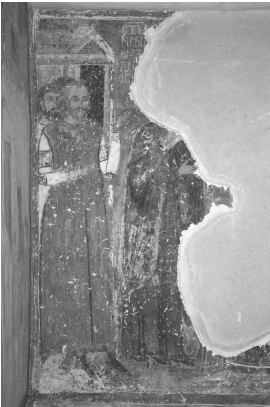
Сл. 3 Исцраћај Симеона на Свейу Гору, јужна капела Радослављеве припрате, Студеница ( https://www.blagofund.org/Archives/Studenica/Main/Pictures/Interior/Exonarthex_King_Radoslav_s_narthex/South_parecclesion_-_dedicated_to_Saint_Simeon_Nemanja/East_wall/East_wall_-_second_row/STUD_3_57.html , Приступљено 5. 9. 2020)