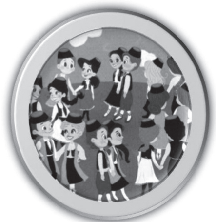
Слика 3: Црногорско народно коло (4. разред, Бигз, стр. 61)

Уз песму „Хајд на рогаљ, момче“ приказана је и народна ношња Јужног Баната. У четвртном разреду ученици који користе Бигзов уџбеник могу се поново подсетити изгледа шумадијске народне ношње приликом слушања народних дечијих игара из централне Србије, али ће упознати и народну ношњу Баната истовремено се упознајући са „Банаћанским колом“ и песмом „Ајд` на рогаљ момче“. У овом уџбенику се налази и неспретна илустрација црногорског народног кола (мушке и женске капе које више подсећају на фес, спорна је расплетена коса девојака) приказаног уз црногорску народну песму „Тита, тита, лобода“.