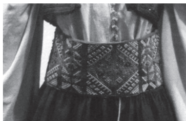
Слика 1: Косовски вез (4. разреда, стр. 53, Нови Логос)

Слике шумадијске мушке и женске народне ношње послужиле су као репрезент СНН у уџбеницима трећег разреда чији су издавачи Klett и Нови Логос, с тим што је прва потписана као Српска народна ношња у Шумадији (Klett), а друга као Традиционална српска ношња (Нови Логос). И једна, и друга без назнаке краја из кога потиче. У Логосовом уџбенику се налазе још два непотписана сликовна приказа шумадијске сеоске и градске ношње.