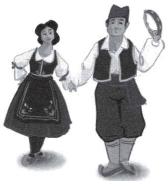
Слика 4: Шумадијска народна ношња (4. разред, стр. 46, Klett)

Вербална, текстуална дескрипција народне ношње скоро да није евидентирана у уџбеницима музичке културе. Ипак, добри примери су дати у Бигзовом уџбенику за други разред, где је појашњено да се народна ношња односи на традиционалну обућу и одећу, уз назнаку да сваки крај има своју народну ношњу. Аутори овог уџбеника су се побринули да ученике упознају са неким елементима женске (јелек, кецеља и опанци) и мушке (шајкача, кошуља, појас) шумадијске народне ношње. У уџбенику трећег разреда истог издавача дато је и појашњење речи: „ џоке – мушки накић , ланице са џочицама чији су крајеви џрикачени за рамена, а ланац се сјушиша низ џруди “ (Марковић, Хршак 2019: 44), с тим што је реч о појмовном појашњењу ученицима непознатог термина из стихова „Банаћанског кола“. Појашњења неких елемената народне ношње (јелек, прегача, опанци, шајкача) дата су у Клетовом уџбенику за први разред уз инструкцију за рад. Ни један наведени пример се експлиците не повезује са српским националним идентитетом.