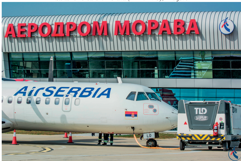
Slika 2. Aerodrom Morava (IATA: KVO), Kraljevo