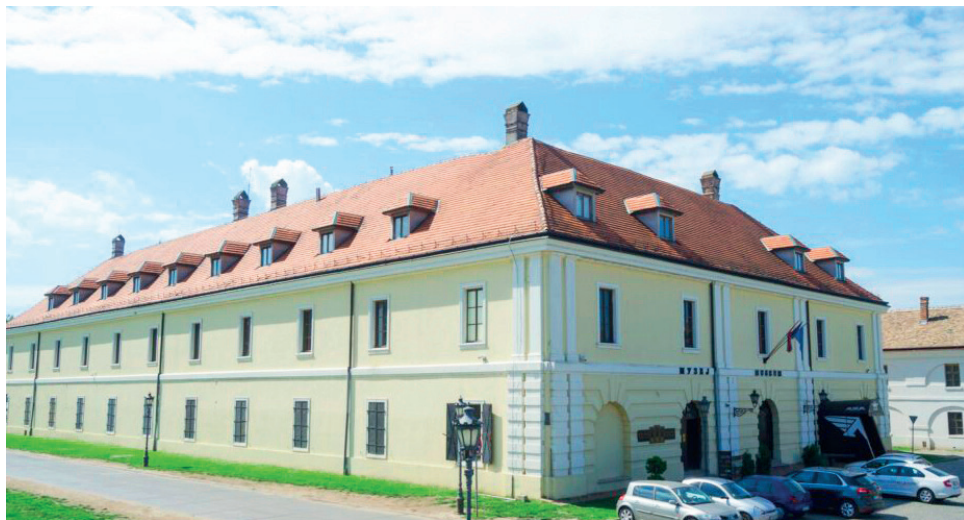
Slika 1. Centralna zgrada Muzeja Grada Novog Sada na Petrovaradinskoj tvrđavi

umetnika kao što su: Save Šumanovića, Đorđa Jovanovića, Boška Petrovića i dr (Domazet i dr., 2018: 48).