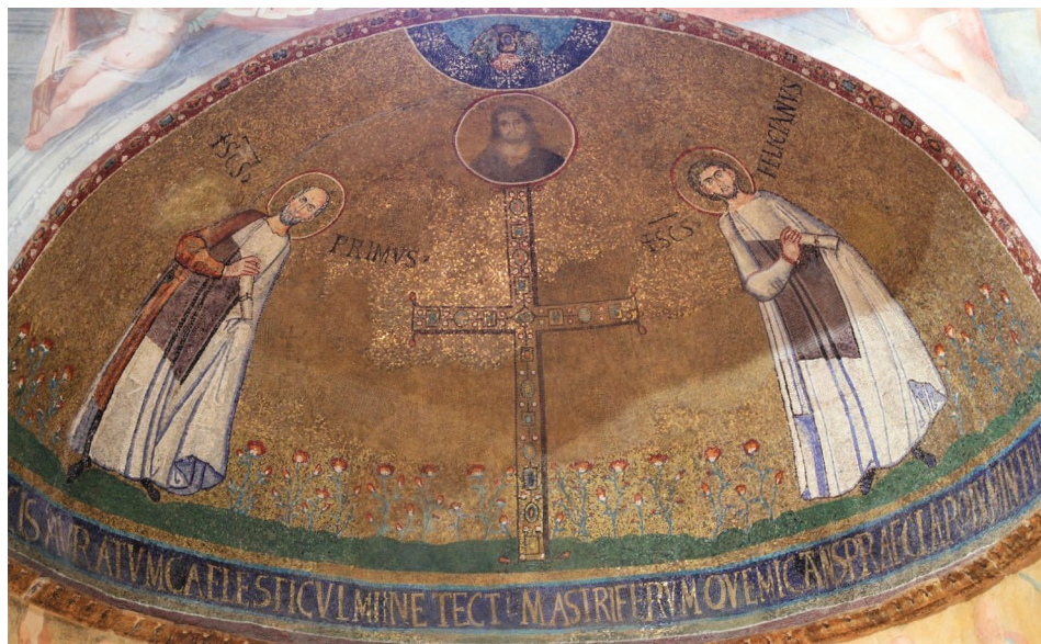
Сл. 4. Апсидални мозаик капеле Св. Прима и Фелицијана, црква Сан Стефано Ротондо, 642–649.

Од Грјура I Великој до Серџија I: њрилој њроучавању књићијорске делайности и њаја у Риму и кулћивоа ранохришћанских марћира