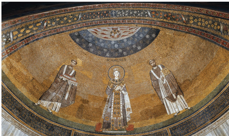
Сл. 2. Апсидални мозаик цркве Св. Агнесе fuori le mura, Рим, 625–638.