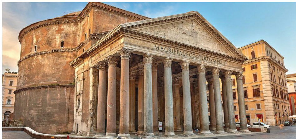
Сл. 1. Пантеон, Рим, данашњи изглед

да је првобитни пагански храм био посвећен свим бојовима . На тај начин, храм је трансформисан у својеврсни хришћански јанџеон у ком су, уз Богородицу, посебно штовани и сви мартири . Значајан податак који је везан за трансформацију Пантеона односио се на чињеницу да је папа даровао храм реликвијама ( Liber pontificalis , 1989, 69.2). Мада немамо подробнијих података, њихово помињање у множини указује на то да је храм, свакако у складу са посветом, био дарован већим бројем различитих светитељских реликвија. Претварање Пантеона у хришћански храм био је, несумњиво, изузетно подстицајан подухват и то у неколико нивоа. Идеолошки, означаио је апсолутни тријумф хришћанства у најнепосреднијем фокусу читаве икумене, али је и значајно утицао на даљи развој, како култа Богородице тако и култова ранохришћанских мученика.