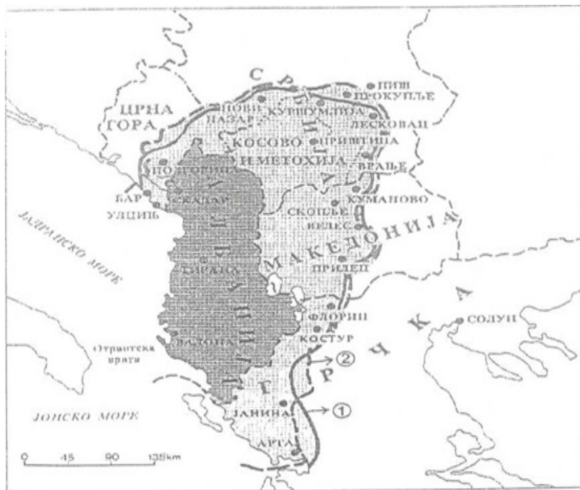
Шема 3: Тзв. Велика Албанија према границама етничке Албаније (1) карта Фекми Костурија из 1938. године; карта са албанских демонстрација у Бриселу